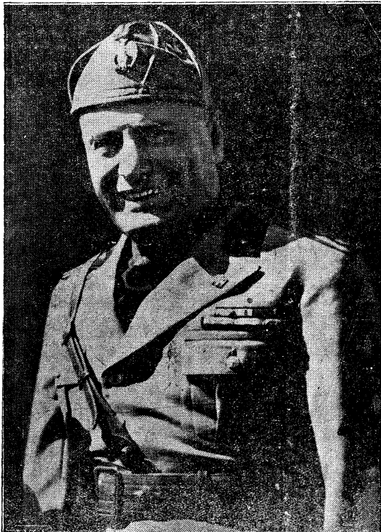
Mussolini, el creador de la nueva Italia, ha dado una prueba más de afecto hacia nuestra Patria. Los niños que la nación italiana ha trasladado a su suelo para que en él disfruten de un pávido verano, han sido visitados por el Duce, que ha tenido ante ellos palabras de amor para la infancia española.

Sobre todas las cosas Españolas, sólo Dios.