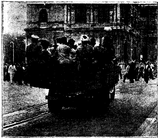
Hoy hace un año. Los primeros moros que desembarcaron en la península cruzan por las calles de Sevilla. El ingenio, la audacia y el valor del general Queipo de Llano hizo pasar a estos moros por su calle. En ese camión se disponen a entrar en la Plaza de San Fernando

SALAMANCA.—Hoy día 18 con motivo del primer aniversario del Glorioso Movimiento S. E. El Generalísimo, hablará por Radio Salamanca a las diez y media de la noche.