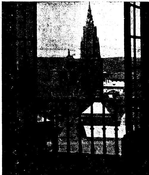
Desde un amplio balcón de la gloriosa fortaleza de Carlos V, se ve firme, majestuosa, erguida hacia el cielo, la gigantesca custodia de piedra, bajo cuyas naves se celebrará hoy la tradicional procesión del Corpus Christi.