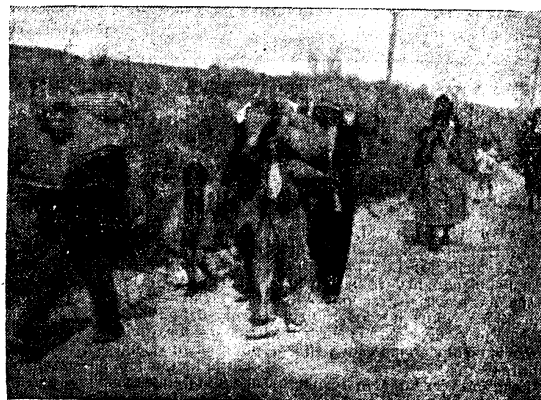
MALAGA.—Aún siguen llegando a la capital nutridos grupos de gente humilde que huyeron antes de la llegada de nuestras tropas. Parece que van con miedo. ¡Tántas cosas le han dicho! Pronto se convencerán de la verdad: la paz y la justicia de nuestro campo

Añade que la población de Madrid está viviendo unos momentos de gran angustia, ya que ve el decaído espíritu de los milicianos y que estos mismos no se recatan de decir que la situación está imposible para ellos.