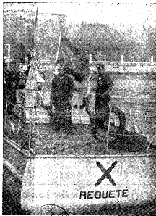
La España del siglo XVI, católica gremial y ahita de tierras, buscó en los mares teatro para sus hazañas, mástil para sus banderas y laureles para su historia. Los Requetés, genuino símbolo y renovación de aquellas gestas gloriosas, no encontrando espacio en tierra para sus hazañas, marcan, con el sello rojo de su cruz de Borgoña, una estela de triunfos en el azul del mar...

Junta de Defensa, presidida por Miajas. De los acuerdos tomados dió una referencia el secretario Carreño, quien dijo que se acordó intensificar la propaganda de reclutamiento de voluntarios y que se obligaba a tomar las armas a todos los hombres de 18 a 45 años; que habían hecho desaparecer los inútiles, y que los que no sirvieran para el servicio de armas, serían incorporados al batallón de fortificación.