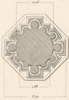
Detalle de un machón de la nave central.