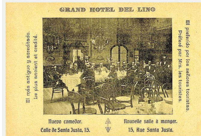
Hoja publicitaria con la inauguración del nuevo comedor en 1901