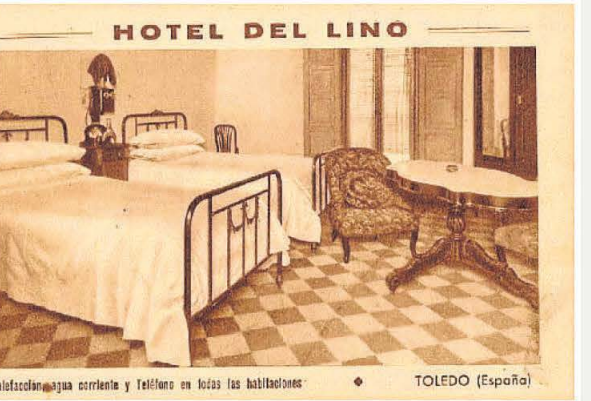
El comedor y una habitación del Hotel del Lino. Postales comerciales hacia 1930