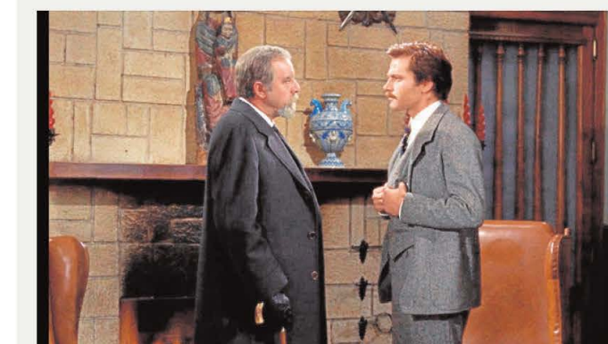
Vestíbulo del hotel en un fotograma de Tristana (1970) con Fernando Rey y Franco Nero