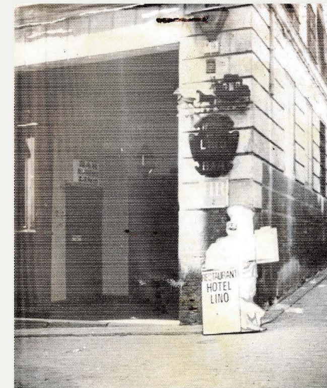
Entrada al zaguán del Hotel en 1983