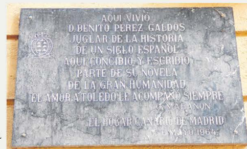
Inscripción dedicada a Pérez Galdós situada en la puerta del Lino