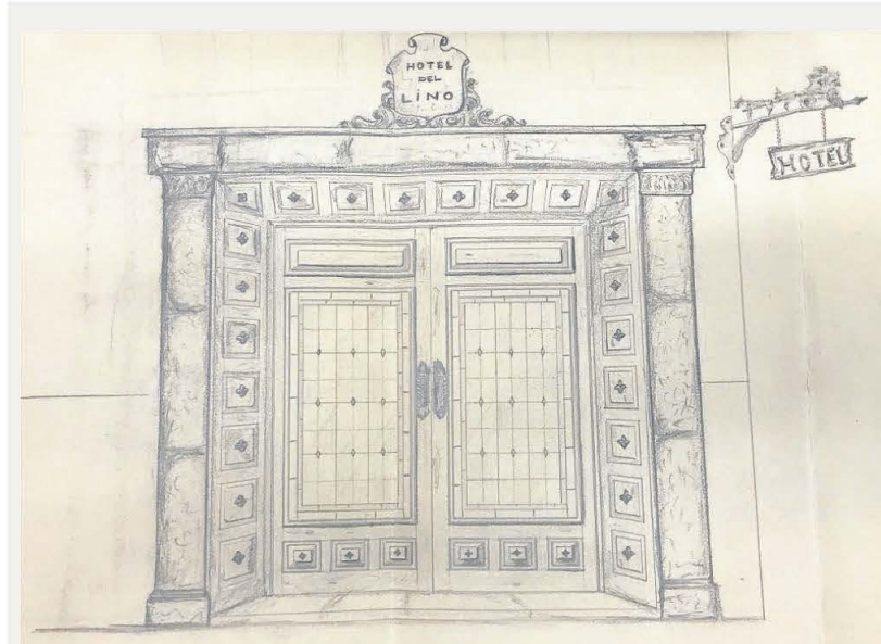
Propuesta para reformar la entrada al Hotel del Lino en 1961.

dor hubo ciertas comidas oficiales, como la celebrada, el 17 de noviembre de 1936, tras decretarse por el gobierno de Franco el «día del plato único». El Ayuntamiento dispuso aquel día un almuerzo para ciento cincuenta personas, entre ellas, el charlista García Sanchiz y las jerarquías civiles y militares. En la década de los años cuarenta, época de escaso turismo con el Castilla ya decaído, el