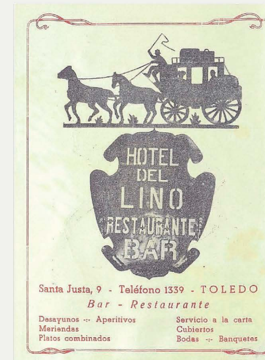
Anuncio en el programa de Ferias y Fiestas de 1961 (Archivo Municipal de Toledo)

Lino siguió siendo un alojamiento de referencia hasta que, en 1951, lo ensombreció el nuevo y flamante Hotel Carlos V.