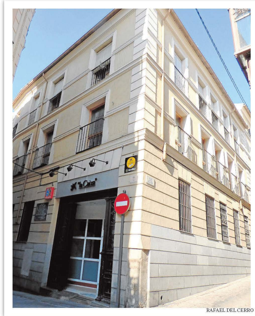
Edificio del antiguo Hotel del Lino en 2016, tras el cierre y la reforma iniciada en 1990