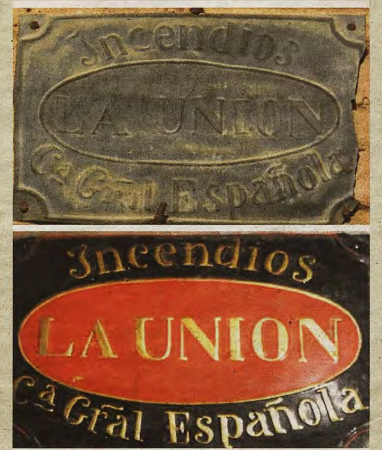
RAFAEL DEL CERRO