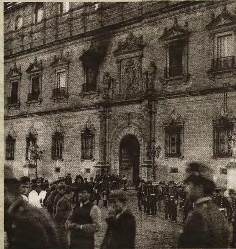
El Alcázar tras el incendio acaecido el 9 de enero de 1887.

Así pues, antes de 1900, eran dos las entidades que tenían la mayor