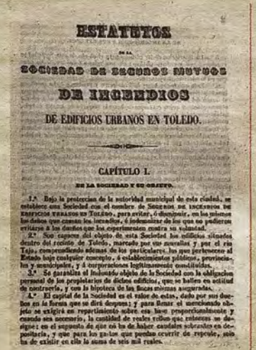
Primera página de los Estatutos de la Sociedad de Seguros La Toledana.

cartera de seguros de incendios; una, por su fuerte raíz local, y otra, por su manifiesta potencia económica. Desde agosto de 1882, La Toledana disfrutaba del permiso municipal para utilizar el escudo de la ciudad en sus documentos y azulejos, como puede verse en infinidad de lugares, algunos pintados y otros resueltos con la artesanal y antigua técnica de arista. La Unión y el Fénix Español se distinguió pronto por su popular y co-