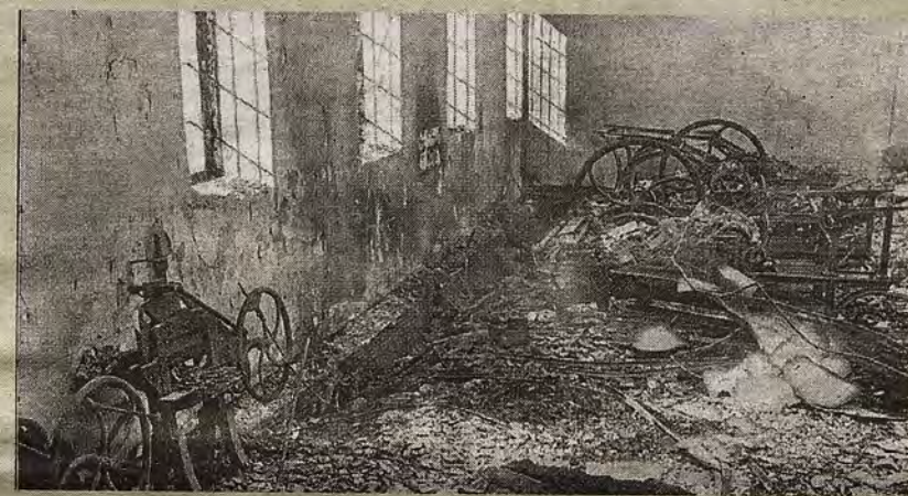
Incendio en la imprenta. Noviembre de 1901.