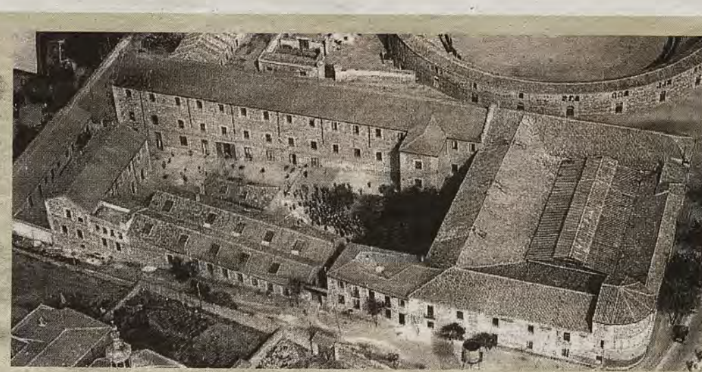
Vista aérea del Colegio hacia 1932. A la derecha, el núcleo de San Lázaro. A la izquierda, los pabellones levantados desde 1895.

ABC DOMINGO, 16 DE DICIEMBRE DE 2018 abc.es/espana/castilla-la-mancha/toledo