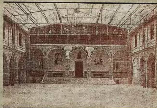
Patio cubierto en la zona administrativa de San Lázaro.

de numerosos actos de la vida colegial. Este arruinado recinto (de 2.872 metros cuadrados) fue segregado más tarde por el Ministerio del Ejército. Lo adquirió una empresa turística ( Pullmantur ) para crear un complejo hotelero, cuyo proyecto lo redactó, en 1968, Fernando Chueca Goita. La obra se ejecutó años después.