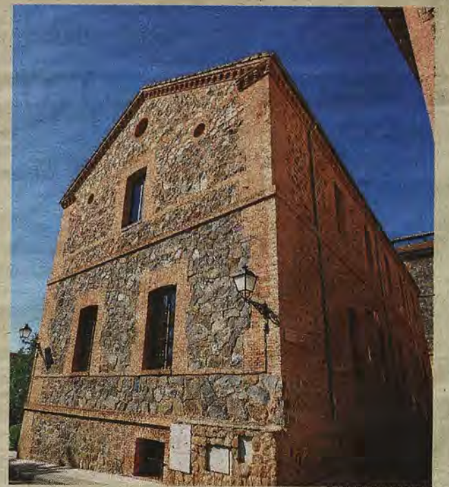
Antigua enfermería del colegio en 2018.

En 1995 se definía el plan urbanizador del viejo conjunto colegial para transformarse en viviendas privadas y usos comerciales. En 1999 se derribaron los edificios menores (como la imprenta) y otros sin valor alguno. Tan solo se rehabilitaron dos en los que aún es posible reconocer los perfiles de mampostería y ladrillo, de finales del XIX, que durante cuatro décadas acogieron la vida del Colegio de María Cristina como testimonian las imágenes y los textos originales durmientes en papel.