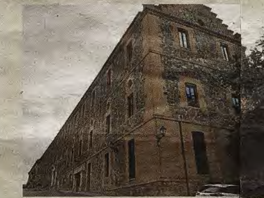
Edificio de dormitorios tras su rehabilitación en el año 2000