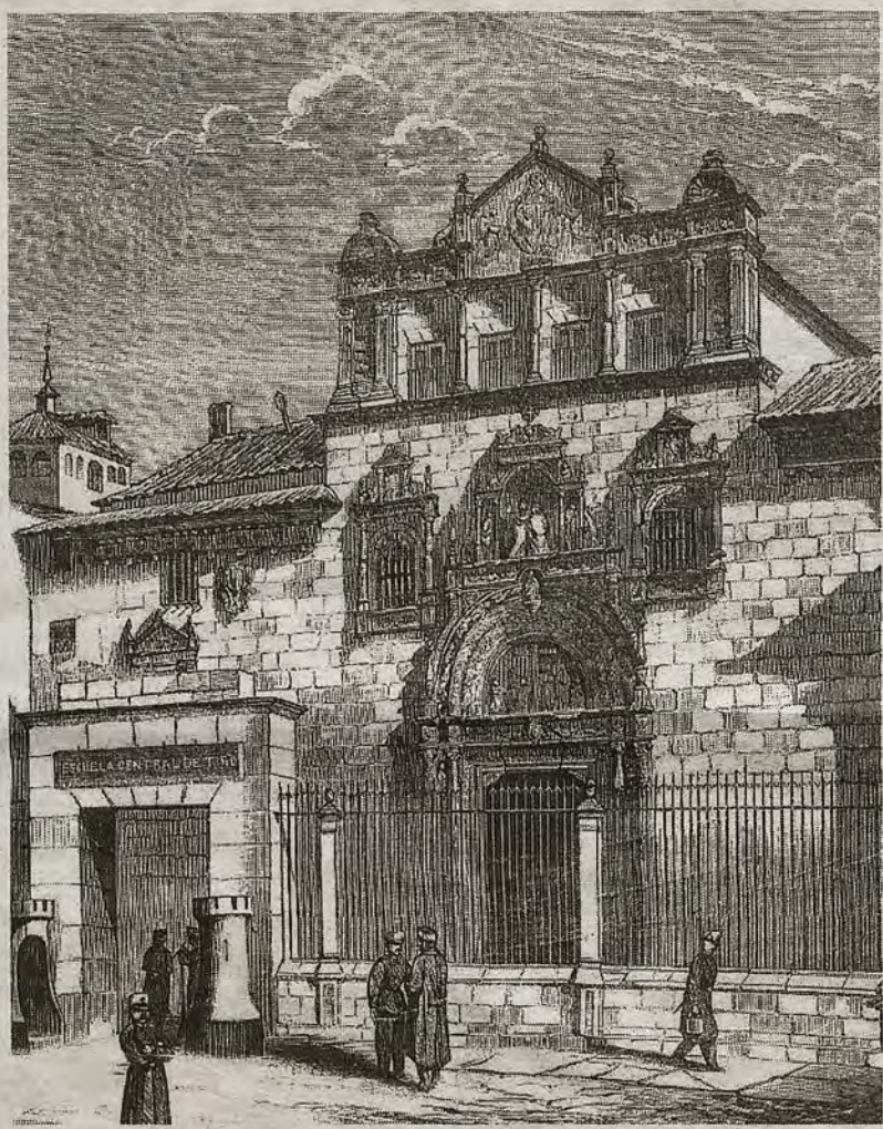
El Hospital de Santa Cruz ( El Globo , 1877). Sede de la Escuela de Tiro y del Asilo de Huérfanos de la Infantería

el toledano cuartel de San Lázaro acogiera el Colegio y su cesión al Ayuntamiento para que éste «llevarse a cabo los ofrecimientos» que había elevado previamente. En 1895, el Ramo de Guerra -sin perder la propiedad- formalizó la entrega a la ciudad. La Corporación puso el terreno público necesario y levantaría las nuevas instalaciones, asumiendo, entre otros aspectos, su mantenimiento periódico, la dotación de agua y posibles ampliaciones de suelo, como la que se efectuó en 1910, contabilizándose 9.332 metros cuadrados en 1940. San Lázaro sería la zona principal y en el solar agregado estaría el internado en torno a un gran patio: dormitorios, comedores, la enfermería, aulas, talleres y otras dependencias. El arquitecto municipal, Juan García Ramírez, redactó el oportuno proyecto cuyo coste rebasaba las 320.000 pesetas. La Asocia-