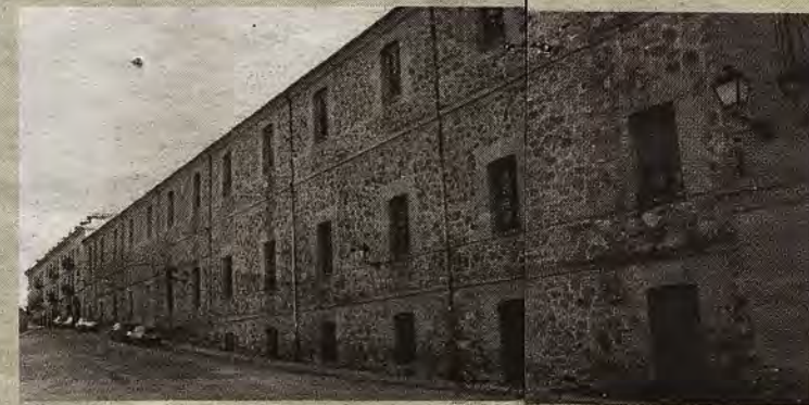
Edificio de dormitorios y comedores según estaba en 1993.

1997, que se extiende a los demás colegios de huérfanos del Ejército de Tierra.