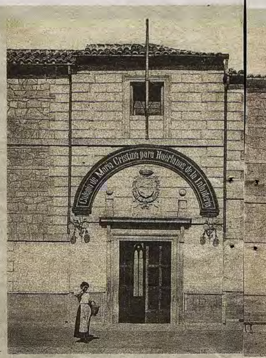
Entrada al Colegio de María Cristina por el edificio de San Lázaro.

DOMINGO, 16 DE DICIEMBRE DE 2018 ABC abc.es/espana/castilla-la-mancha/toledo