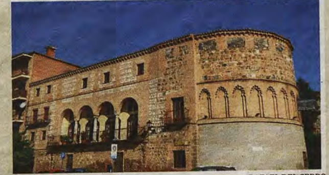
RAFAEL DEL CERRO