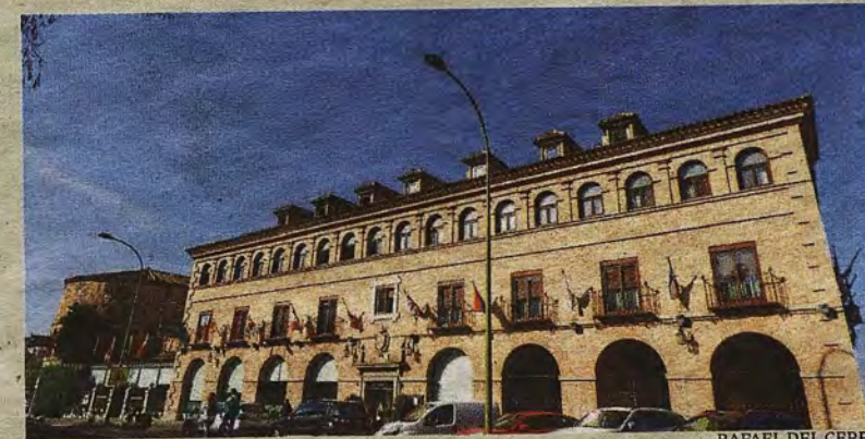
RAFAEL DEL CERRO