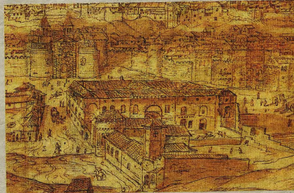
En primer término, el hospital de San Lázaro en 1563. Detrás el edificio de Tavera en construcción. Dibujo de A. Wyngaerde

Regimiento de España y el Regimiento Infante D. Antonio. En el marco de la I Guerra Carlista (1833-1840) se hospedaron allí un batallón del Regimiento Zaragoza 12, el Provincial de Écija 13 y tropas del Regimiento de Infantería Ceuta 9. El cuartel de San Lázaro acogía la plana mayor de las fuerzas de plaza, dormitorios para dos o tres compañías, cocina, almacenes y pertrechos. Los cercanos parajes de San Eugenio y Palomarejos facilitaban la instruc-