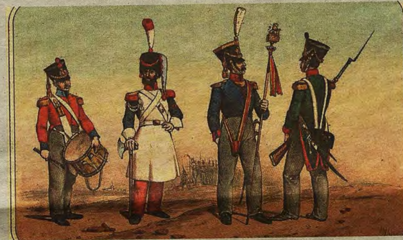
Soldados de Infantería en 1821. Litografía de Villegas (1861)