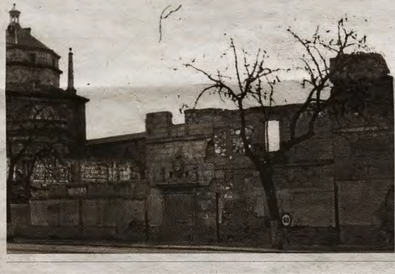
Fachada principal de San Lázaro en una postal de 1930 y el aspecto, en 1965, destruido desde 1936.

tel de Caballería, dotado de un gran corral, cercano a espacios abiertos y a los recursos de agua para las cabalgaduras. Pero aquel plan no se llevaría a cabo y la fuerza montada abandonaría la ciudad en 1791. Precisamente, en junio de ese año sería efectiva la extinción de los antonianos, al tiempo que un ordenamiento de Carlos IV fijaba un Regimiento de Infantería en Toledo, cuyos efectivos serían 1.500 soldados, distribuidos en tres batallones que reunirían doce compañías de fusileros y dos de granaderos. San Lázaro fue señalado como su cuartel, ocupado ya en el mes de septiembre, aunque la fuerza permanente allí instalada no sería mayor de un batallón. Por otra parte, mencionemos que los enfermos sacados de San Lázaro permanecieron en el vacío hospitalito de San Antón hasta 1793. De ahí, fueron trasla-