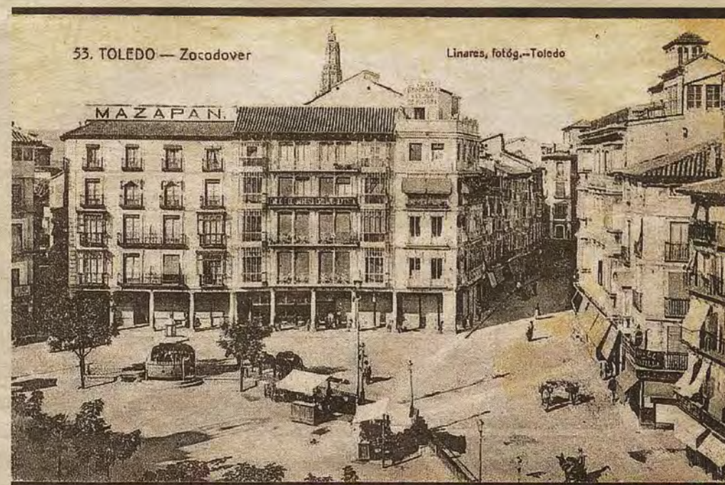
Zocodover. Panorámica de la manzana tras su reforma aprobada en 1906 en una postal de Linares.

ABC DOMINGO, 7 DE OCTUBRE DE 2018 abc.es/espana/castilla-la-mancha/toledo