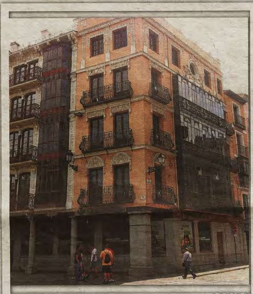
RAFAEL DEL CERRO

Sobre El Español , el 22 de febrero 1909, dos días después de su inaugu-