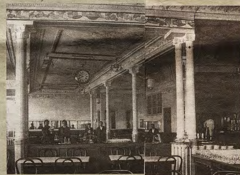
Interior del Café Español abierto en la planta baja.

de Infantería de Toledo (1908). La actividad del Casino se extendió algún año al Teatro Rojas los días de Carnaval, además de salteadas reuniones familiares. El 6 de diciembre de 1913, El Día de Toledo informaba el traslado de la entidad a la plaza de San Justo, 7, a un edificio con «espaciosas habitaciones, de verano y de invierno, proponiéndose la Directiva celebrar fiestas y exhibiciones cinematográficas y otras distracciones, a las que podrán asistir los señores socios con sus respectivas familias». Quizá el nuevo domicilio