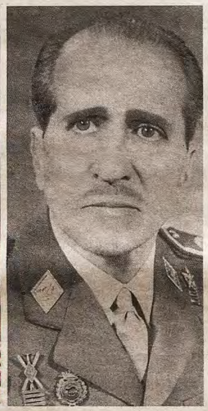
El general Ricardo Villalba Rubio y el coronel Federico Inglés Sellés vinculados al naciente Toledo FC y al atletismo toledano.

del país. Y es que los torneos ya exigían espacios adecuados y reglamentos concretos. El Toledo daría pues el paso para aparejar su propio campo, ajeno a las explanadas militares del Polígono de Tiro. Espacio que se creó en 1868, bajo el cuartel de San Lázaro y que, desde 1919, sería la cuna de la nueva Escuela Central de Gimnasia del Ejército, foco difusor del deporte en Toledo.