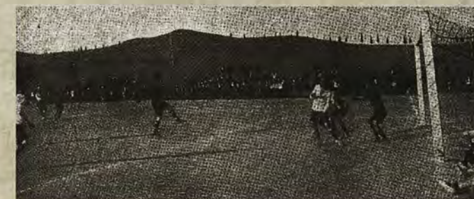
Encuentro de fútbol del Toledo, en 1924, en la Escuela Central de Gimnasia, conocido como el Campo del Polígono