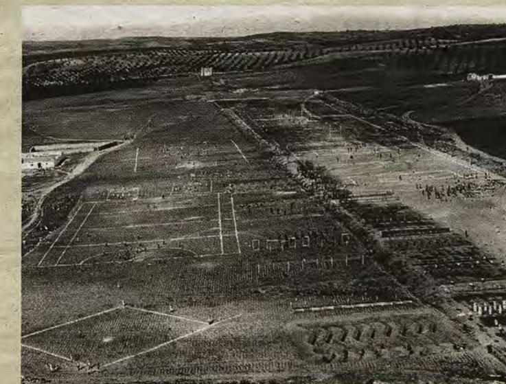
Campos deportivos de la Escuela Central de Gimnasia, creada en 1919, en una vista anterior a 1936

miembros de la Casa del Pueblo. En estos momentos, las tribunas obreras solían recomendar a los obreros alejarse de las tabernas y de "otros vicios", elogiando una vida sana, la unión y la cultura como "claves de la emancipación proletaria". Los centros educativos públicos -como el Instituto- o privados -caso de los Hermanos Maristas y academias varias- apoyaban la Educación Física y las competiciones de fútbol con sus propios equipos en encuentros que solían tener lugar en el citado Polígono. En estas iniciati-