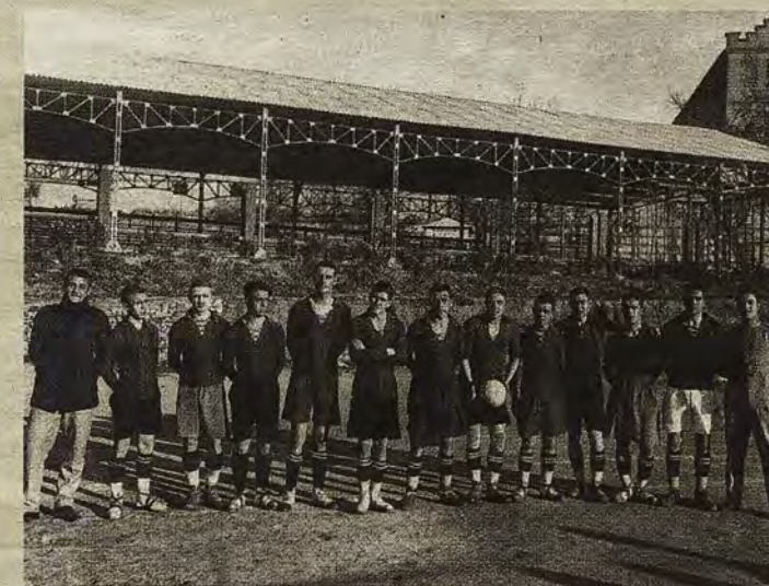
Equipo de fútbol de la Academia delante del primitivo gimnasio cubierto cerca del antiguo cuartel de San Lázaro.