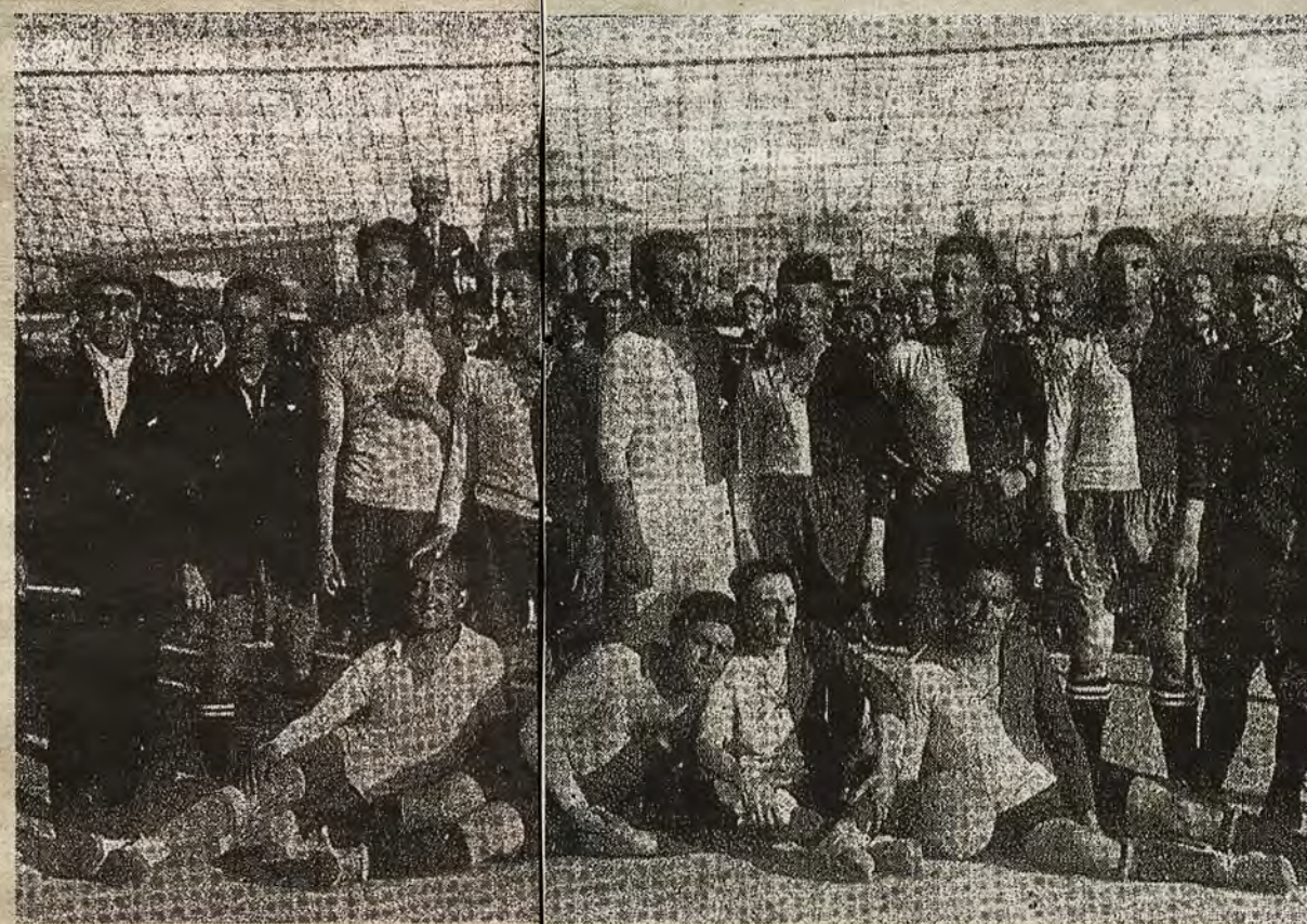
Equipo del Toledo FC en una competición organizada por el diario El Castellano en la primavera de 1924