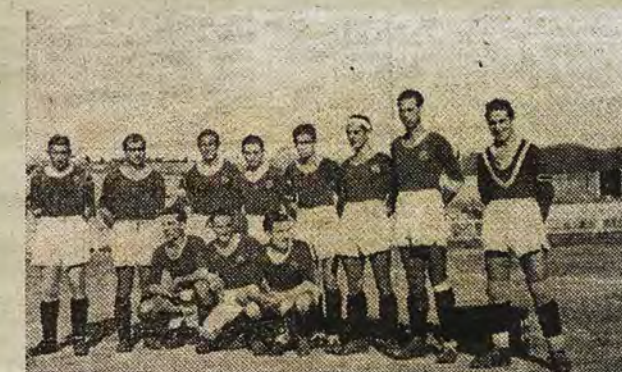
Equipo del CD Toledo , en octubre de 1943, en su campo de Palomarejos.