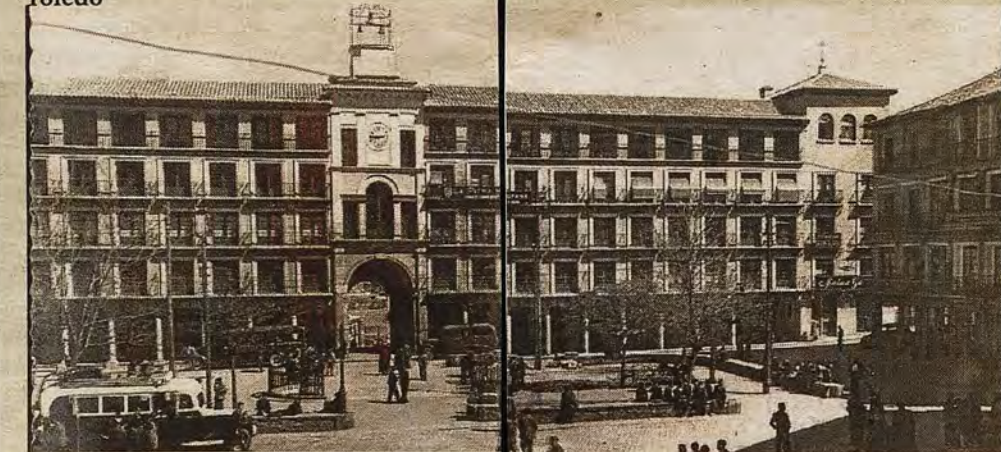
Fachada del Arco de la Sangre y aspecto de la plaza en torno a 1955 con el paseo central creado en 1926.