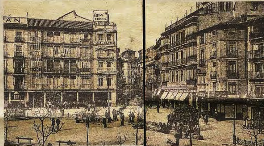
Distribución de la plaza de Zocodover, hacia 1910, en una postal de Hauser y Menet. Colección Archivo Municipal de Toledo