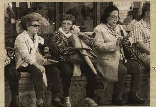
Anónimos protagonistas en el escenario de Zocodover, en octubre de 2015.

nes neutrales aunque, al final, «todo quedó en tablas... como las grandes gestas de la Historia». En la primavera de 1926 la discutida reforma había concluido.