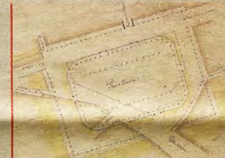
Proyecto para ordenar Zocodover en 1854 según el arquitecto Santiago Martín y Ruiz.