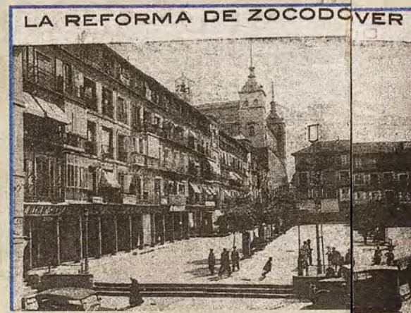
Reportaje en la revista Toledo (agosto de 1925) sobre el nuevo cambio en Zocodover que mantenía la misma forma desde 1865

DOMINGO, 3 DE SEPTIEMBRE DE 2017 ABC abc.es/espana/castilla-la-mancha/toledo