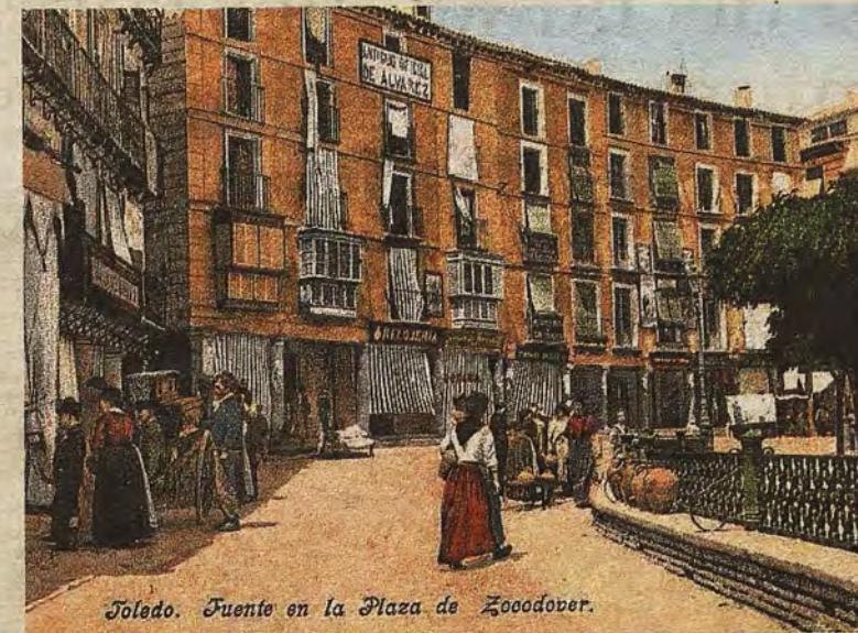
Zocodover en una postal de Purger & Co, editada hacia 1903. Al fondo los antiguos soportales de la Vidriería.

ABC DOMINGO, 3 DE SEPTIEMBRE DE 2017 abc.es/espana/castilla-la-mancha/toledo