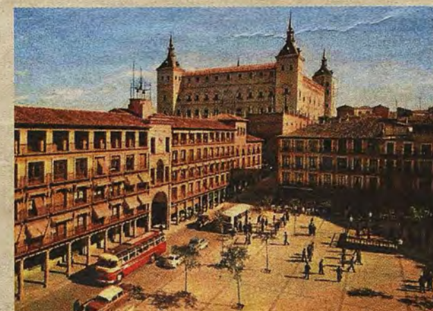
Postal editada en 1963 por L. Arribas de Toledo.