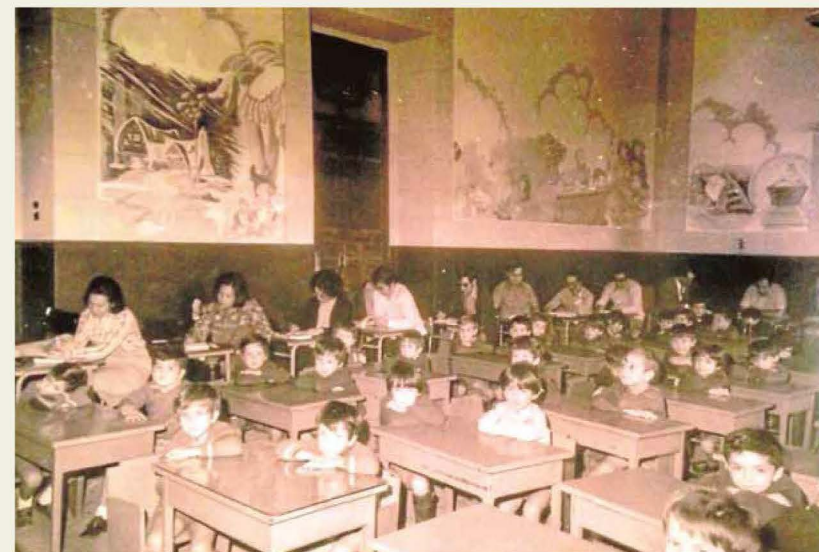
Aula de la Graduada San Servando en la Diputación con la presencia de alumnos de Prácticas de Magisterio en 1974.