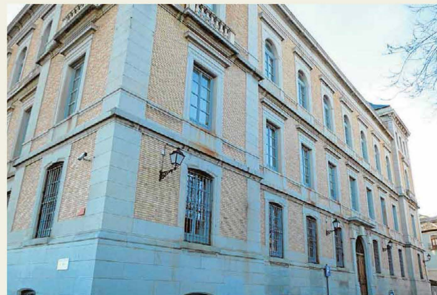
Edificio de la Diputación. Fachada de acceso a la Escuela Graduada San Servando. FOTO Rafael del Cerro

Fotografía: Castillo de San Servando fotografiado por Casiano Alguacil hacia 1885. ARCHIVO MUNICIPAL DE TOLEDO