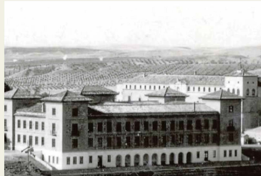
Edificio de la Escuela de Magisterio hacia 1935 y aspecto del mismo en los años sesenta.