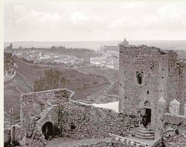
Interior del castillo de San Servando hacia 1925.