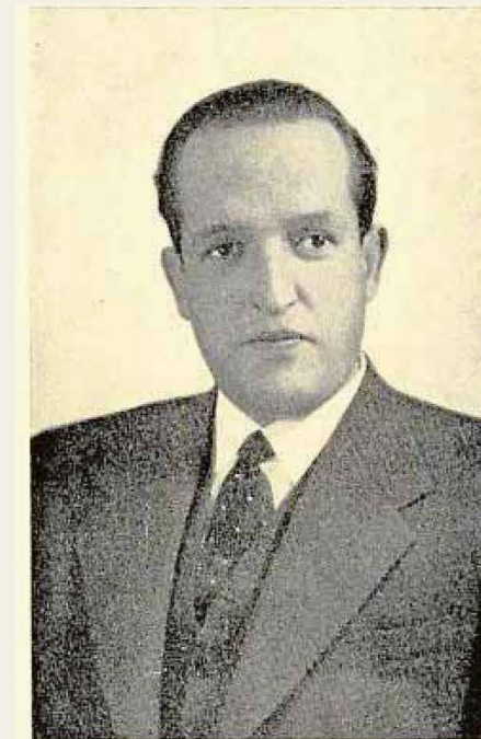
Blas Tello y Fernández Caballero, gobernador civil de Toledo entre 1944 y 1951