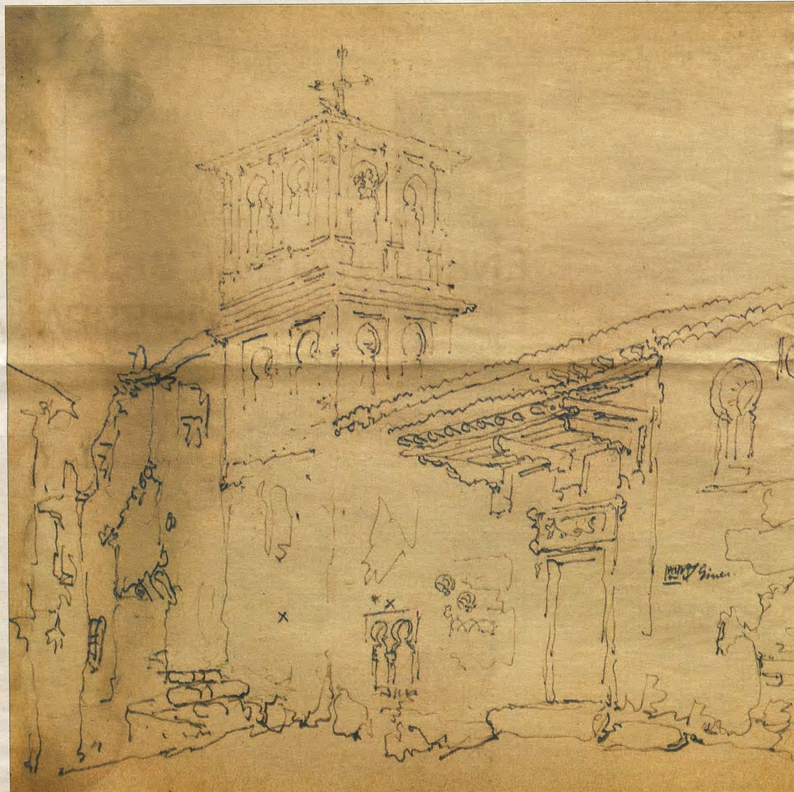
La representación del templo procede de un álbum de dibujos de Pérez-Villaamil en propiedad particular. / PABLO NAVARRO ESTEVE

El dibujo de Villaamil es extraordinario por ofrecer numerosos detalles sobre la morfología de la fachada de la iglesia al callejón de San Ginés. A pesar de tratarse de un simple dibujo a lápiz sobre papel -sistema empleado por el pintor para trabajar posteriormente en óleos y grabados, en un momento en el que la fotografía no se había generalizado aún en España-, en él pueden apreciarse elementos tan específicos como las dos veneras visigodas reaprovechadas en la fachada del edificio o la pequeña ventana geminada que, tras el derribo, sería trasladada al Museo Arqueológico Nacional, en donde todavía se conserva. Asimismo, es posible contemplar el tejero de grandes