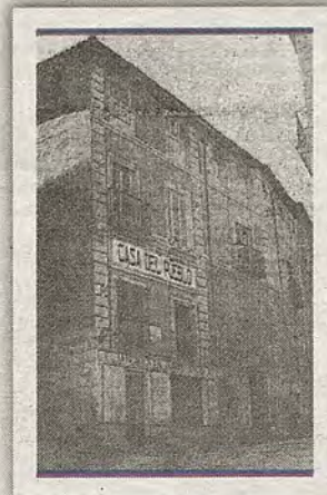
Sede de la Casa del Pueblo en la calle Núñez de Arce. El Proletario (1-mayo-1927)