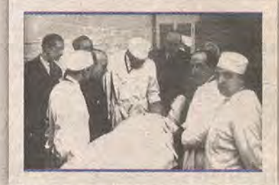
A la derecha, herido atendido en el Hospital Provincial, en la plaza de Padilla. Marzo de 1932