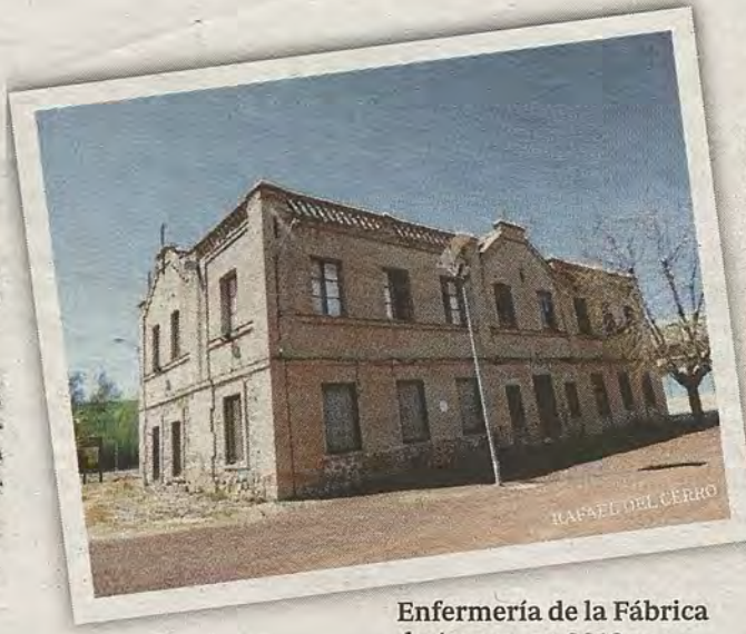
Enfermería de la Fábrica de Armas, en 2016

Consulta de Mecánico-Dentista en el Hotel Imperial (1909)