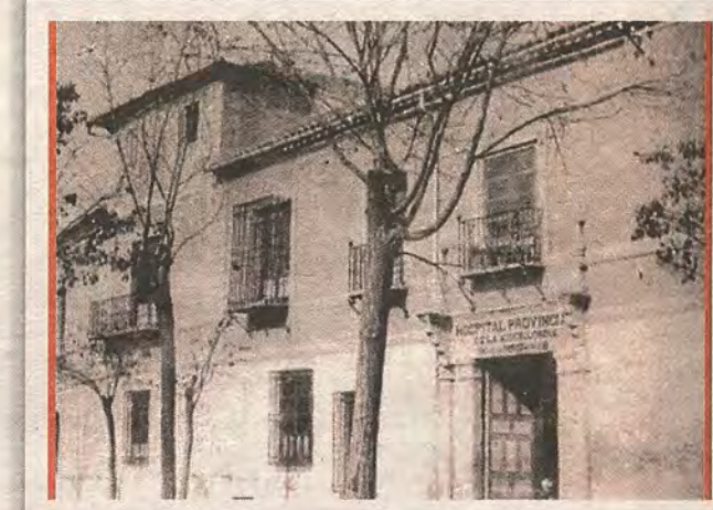
El Hospital Provincial en la plaza de Padilla