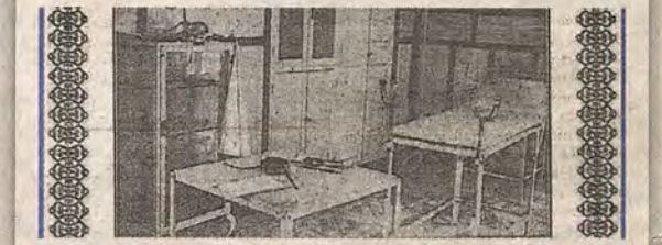
Clínica de la Casa del Pueblo. El Proletario (1-mayo-1927)