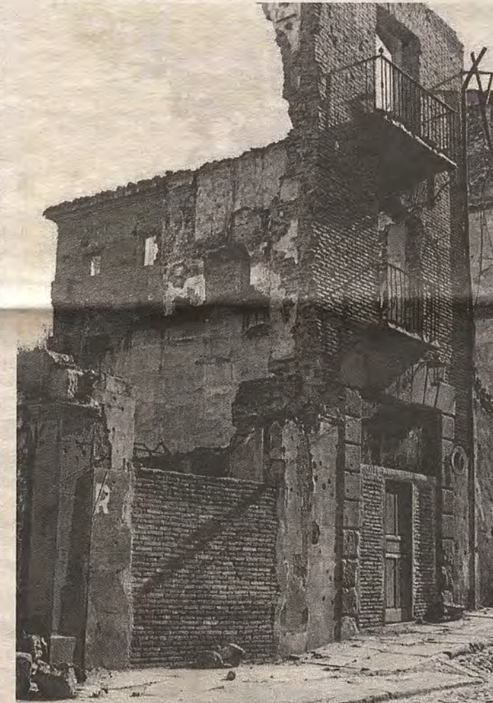
Ubicación de la Casa de Socorro en la cuesta del Alcázar. Aspecto del edificio en 1906, finales de 1936 y en octubre de 2016 (a la derecha)

bre de 1936, el inmueble, al estar al pie del Alcázar, quedó reducido a escombros, trasladándose la función curativa, de modo transitorio, a la residencia de los jesuitas, en la calle de Alfonso XII, a la sazón vacía. Años después la Casa de Socorro pasó a la calle del Barco y, más tarde, a la de Capuchinos, donde llegó su definitiva clausura en 1990.