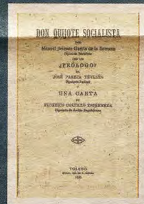
Portada de la publicación Don Quijote Socialista