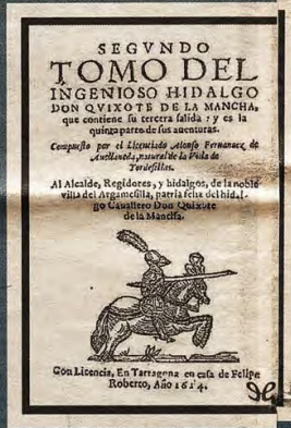
Segunda parte del Quijote escrita por Fernández de Avellaneda (1614)