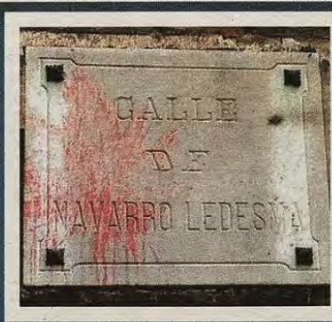
Lápida colocada en noviembre de 1906 con los efectos de una moderna agresión «pictórica».

Nuestro periodista falleció el 21 de septiembre de aquel año, en el número 70 de la madrileña calle de Serrano. La noticia tuvo un amplio eco en toda la prensa. En Toledo abundaron las reseñas en La Campana Gorda , El Día de Toledo , La Idea o el Heraldo Toledano , creciendo el deseo de organizar un gran homenaje. Muy pronto, en la sesión municipal del 27 de septiembre, se aprobó renombrar la calle de Nuncio Viejo a favor de su memoria, desde las Tendillas hasta Hombre de Palo. Se le consideró como un ilustre toledano, si no de nacimiento, al menos como residente y evidentes nexos con la ciudad. Sin embargo, todo ello encalló pronto. La placa de la calle se colocó, sin relevancia alguna, el 2 de noviembre de 1906. En los años siguientes, vehementes concejales conservadores rechazaban que el Ayuntamiento propiciase más agasajos, sumándose a ello, en 1912, el periódico carlista El Porvenir ante la posible inclusión de un acto literario en las fiestas del Corpus. En 1916, la calle de Navarro Ledesma vio recortada su denominación al recuperarse el nombre de Nuncio Viejo, en el tramo comprendido entre la plaza de Amador de los Ríos y la esquina con Hombre de