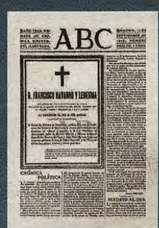
Notificación de la muerte de Navarro Ledesma en ABC (22 de septiembre de 1905)