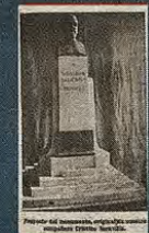
Monumento proyectado por Cristino Soravilla publicado en Toledo. Revista de Arte (1 de diciembre de 1925)