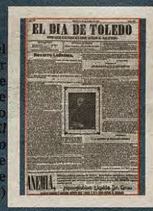
Recuerdo del primer aniversario de la muerte de Navarro Ledesma en El Día de Toledo (22 de septiembre de 1906)