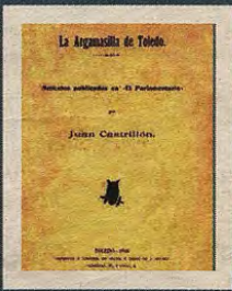
La Argamasilla de Toledo de Ventura F. López, obra firmada con el seudónimo Juan Castrillón