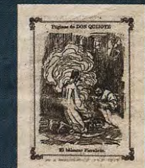
Ilustración sobre El Quijote en La Campana Gorda (11 de mayo de 1905)