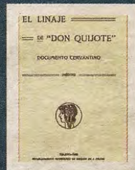
El linaje de Don Quijote (1922)

Sin duda que la vida y la obra de Fernández López reúnen un largo compendio de rarezas y dislates que llevó a su devoción cervantina, concretada más en la figura de don Quijote (por cierto, personaje también de juicio quebrado) y sus relaciones con los escenarios toledanos. Más allá de la lectura lineal de tan singular legado, en el fondo, subyace el sincero homenaje que salió de la pluma de aquel «cura loco» que llenó una época. Su recuerdo reposa hoy arrinconado en las estanterías de las bibliotecas o de coleccionistas particulares que le libran así de la sima del pleno olvido.