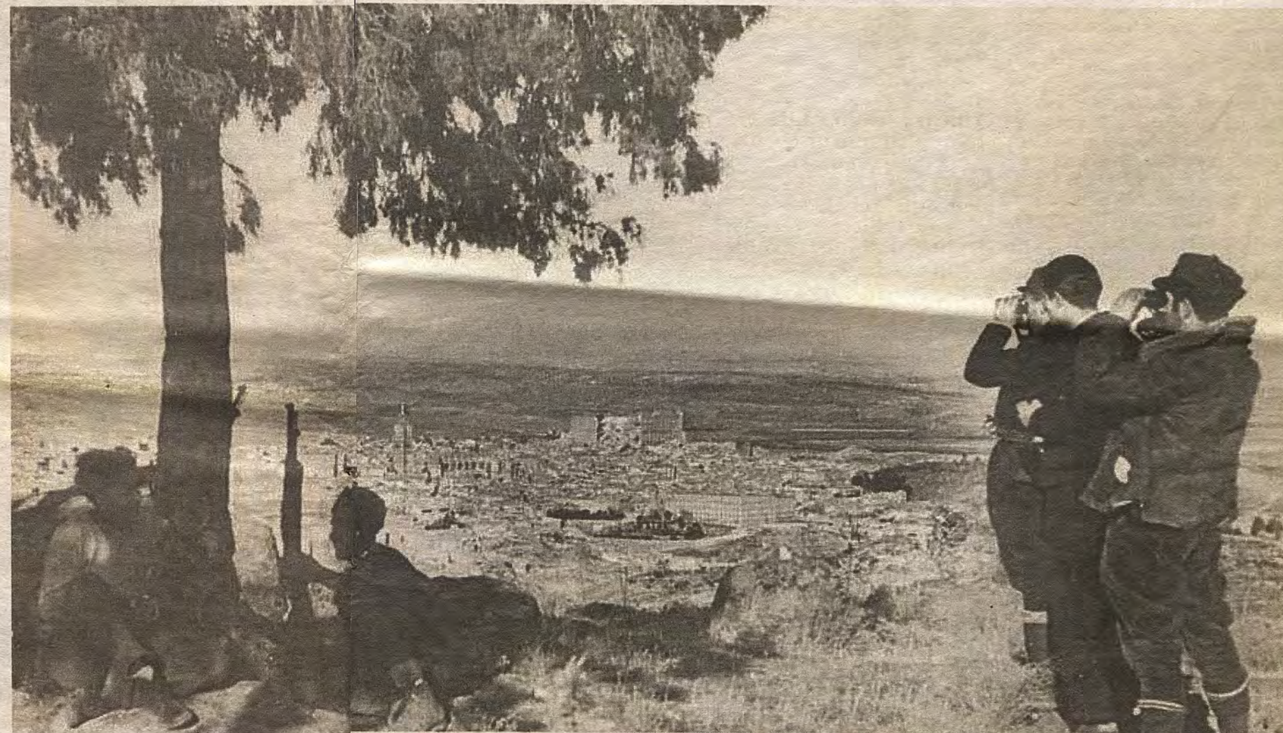
Posición republicana sobre Toledo desde los Cigarrales. Imagen publicada por la prensa en febrero de 1937

Hacia el oeste de la ciudad, a pocos metros de la ermita de la Virgen de la Bastida, entre los pinos, apenas son ya reconocibles las zigzagueantes trincheras desde las que se hostigaba con tiro directo a la Fábrica de Armas. Bajo las laderas de este cerro, por la carre-