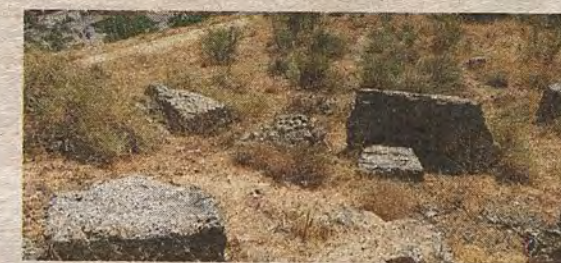
Vestigios de búnkeres en la Fuente del Moro

y concentración de la zona nacional dependiente de la Inspección de Cáceres con algunos batallones de trabajo, siendo parejo a los creados en Talavera de la Reina y otros puntos de la provincia. Para tal fin, antiguas dependencias del caserón principal fueron convertidas en celdas de reclusión, al menos, hasta 1942. Desconocemos si aún hoy perduran las inscripciones (a lapicero y carbón), hechas por los allí internados que aún, en 1976, pudimos ver, en las paredes de aquellas herméticas estancias que contrastaban con la frondosa vegetación, los estanques y los jardines decorados con vistosas cerámicas de temas toledanos hechos por Daniel Zuloaga hacia 1919.