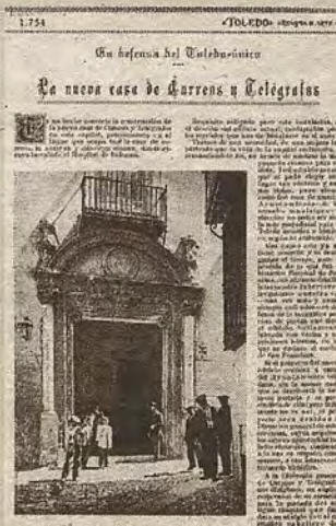
Revista Toledo, octubre de 1927. El edificio de Correos antes de su reforma