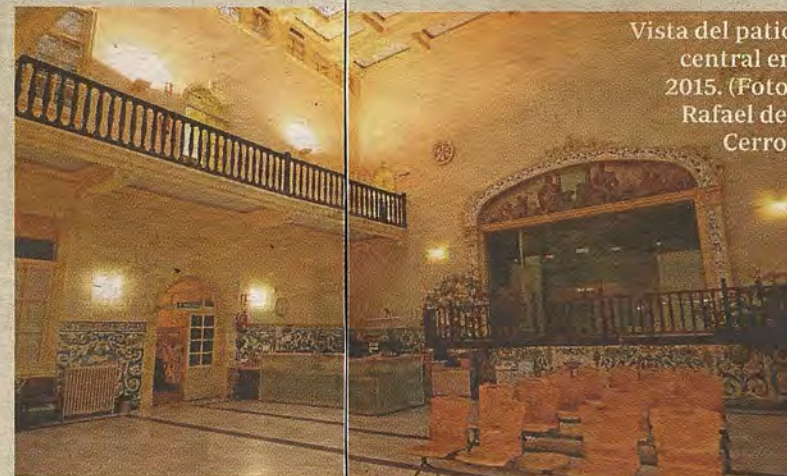
Vista del patio central en 2015.