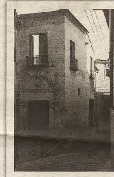
Palacio de los condes de Oñate en 1947. Inicio de la reforma de la puerta principal en 1947.

Lo cierto es que pasaron los años sopesándose varias casas y solares para erigir un edificio de nueva planta, entre otros, la plena ocupación de la plaza de los Postes por su céntrica situación. Mientras, en el vetusto caserón de Bálamo, Correos seguía en precario, acordándose su compra, por fin, en 1927, para ser totalmente reformado. Las obras arrancarían en 1929, siendo inaugurada la nueva sede en marzo de 1933. En este período, el servicio postal se llevaría a la antigua casa