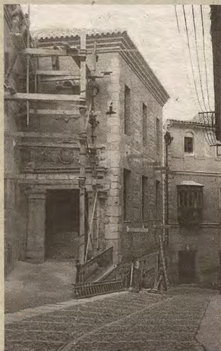
Fachada principal tras su reforma.