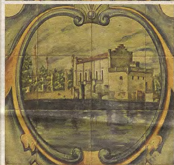
Vistas de la Fábrica de la azulejería de V. Quismondo