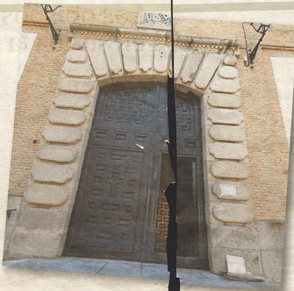
La portada procedente de la calle de las Cadenas. Foto R. del Cerro Municipal de Toledo)