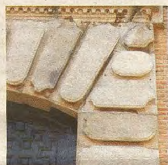
Detalle de la cantería barroca (R. del Cerro)