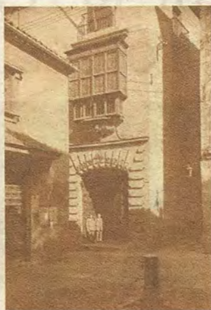
Sede del Banco de España, esquina a la calle Nueva, en el primer tercio del XX. Casiano Alguacil (Archivo Municipal de Toledo); abajo, 4. Cruce de las calles de las Cadenas y Nueva en 2015. (R. del Cerro)