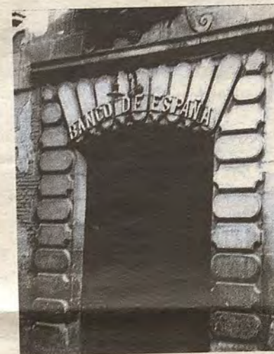
La puerta del Banco de España antes de ser desmontada en 1949