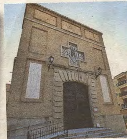
Fachada de la iglesia de Santa Bárbara. (R. del Cerro)