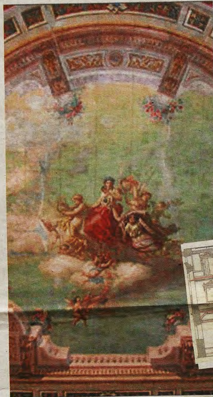
Teatro de Rojas Pintura de la cubierta de la sala general (a la izquierda). Foto Teatro Rojas. Abajo, interior de la sala de espectadores. (R. del Cerro)