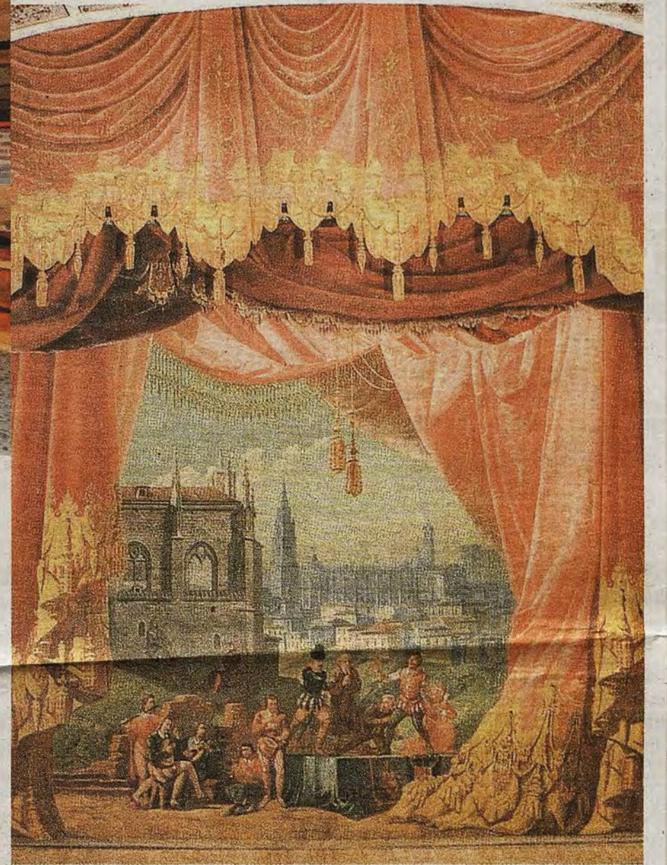
TEATRO DE ROJAS

La vida de esta caja mágica comenzaría a cumplir debidamente su cometido desde el sábado 18 de octubre de 1878 hasta la actualidad