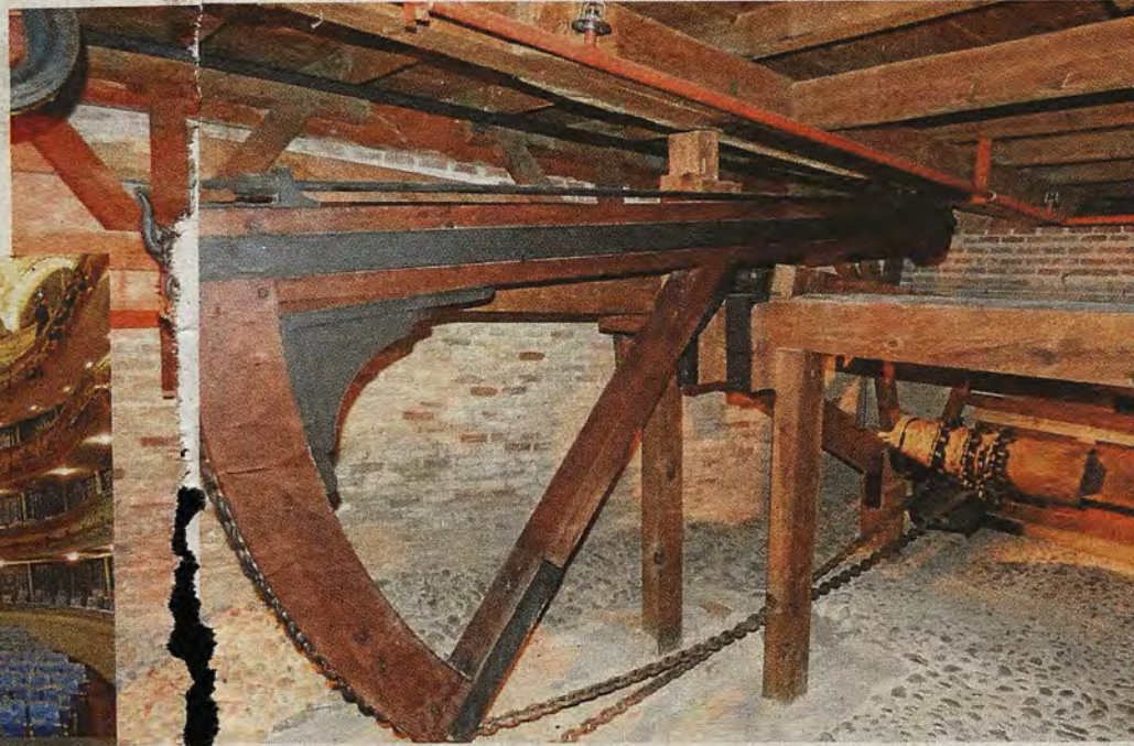
Detalle de la maquinaria para elevar el patio de butacas. Abajo, arco de embocadura del escenario. A la derecha, telón de embocadura.

Concluidas pues las obras, la vida de esta caja mágica comenzaría a cumplir debidamente su cometido desde el sábado 18 de octubre de 1878 hasta la actualidad.