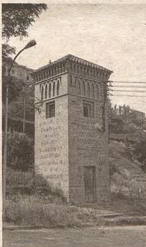
Torre ya desaparecida en el inicio de la avenida de la Cava