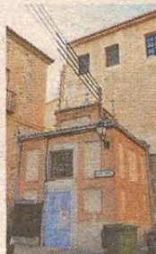
Pabellón en Santa Isabel