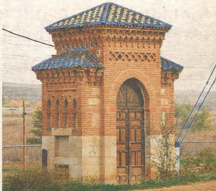
Transformador en la Estación de Ferrocarril