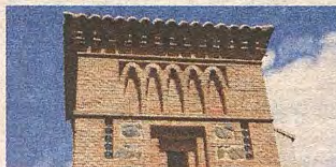
Detalle de Santa Ana

También se pueden reseñar dos estructuras en puntos distintos. Una, en Santa Bárbara, en la subida del Hospital, de aspecto totalmente industrial, a base de mampuestos y ladrillos, alineada con las viviendas colindantes, y otra, en el seno del Poblado Obrero, en el perímetro del colegio que, tras una reciente intervención, ha perdido algún ribete de color verde en la madera que contrastaba con las encañadas paredes, una cenefa de ladrillo rojizo, quedando rematado por una cubierta de teja plana, elementos concordantes con la imagen exterior de toda la barriada.