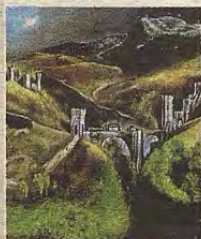
Torreón exterior pintado por el Greco