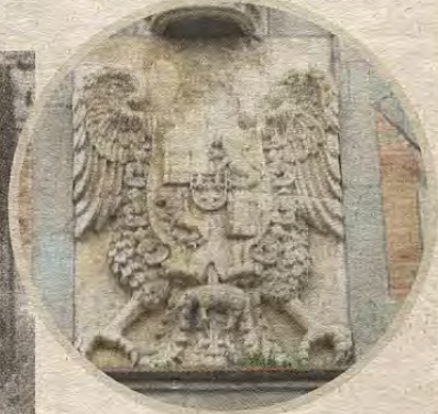
Detalle actual del escudo