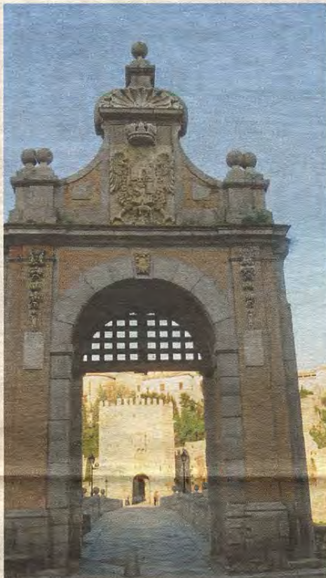
El puente Alcántara, en la actualidad

Como es sabido el referido puente para salvar el Tajo se remonta a los planes de los ingenieros romanos, integrado en la calzada que bordeaba el escarpe rocoso de Toletum hacia la Baetica. En el largo medioevo, el pasadero de Alcántara tuvo derrumbes y reformas, quedando en la orilla derecha el castillete almenado, dotado de rastrillo y otros elementos propios de la arquitectura militar del siglo XV. En la orilla contraria, el puente se apoya en un sólido paredón horadado con un pequeño arco de herradura, carente del torreón medieval que aquí hubo,