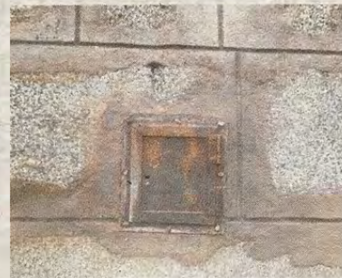
Cajetín del interruptor colocado en 1924

Anuncio de 1924 publicado en El Castellano