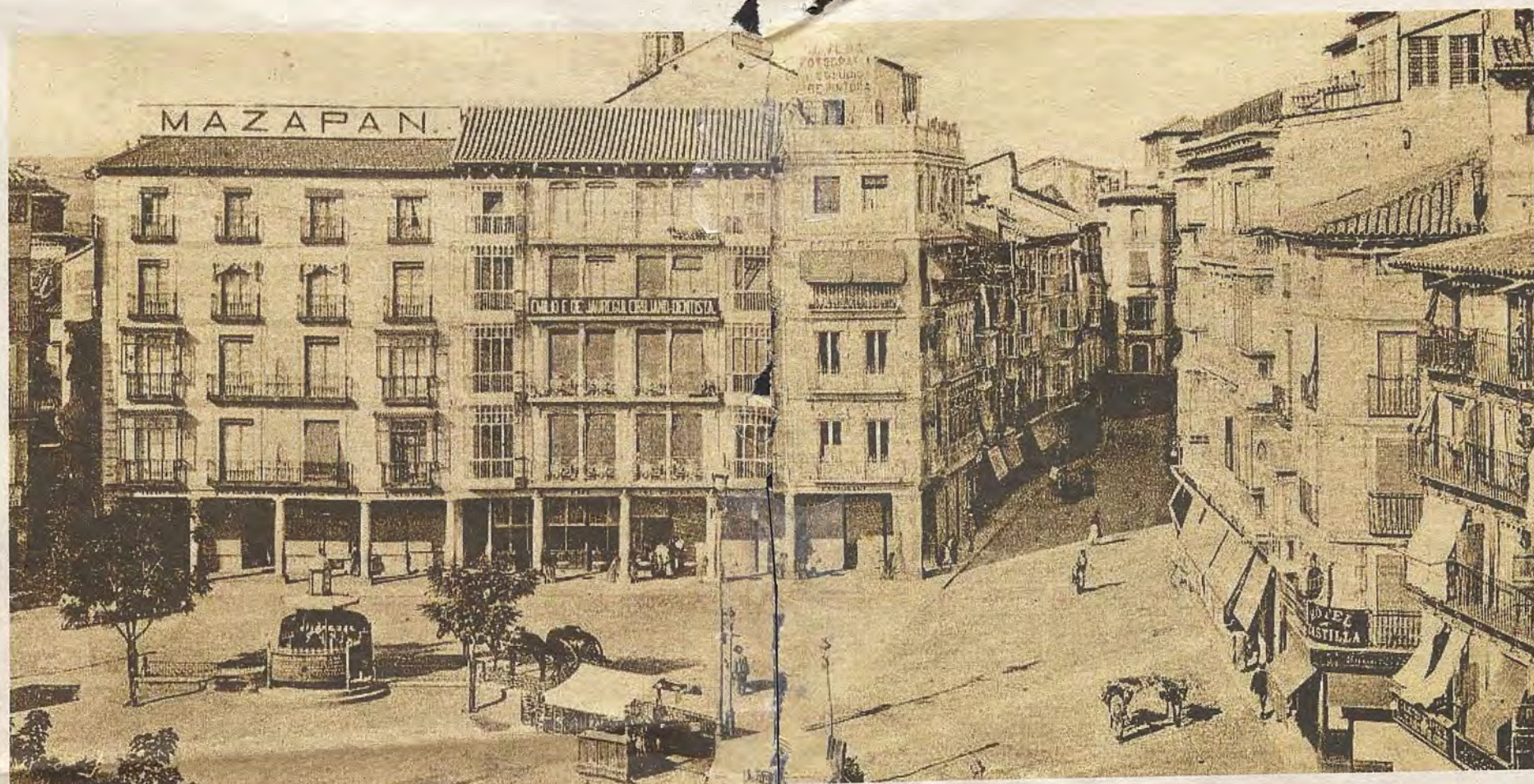
La plaza de Zocodover