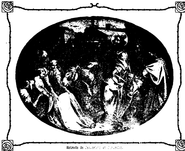
Entrada de Jesucristo en Jerusalén.

el odio con que le distinguían, que llegó á conocimiento del presidente romano, quien no se recataba de decir que le habían entregado por envidia, la más baja de las humanas pasiones.