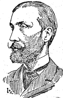
El subsecretario D. José Herrero.

La impresión de los que acompañaban al ministro, acerca de las buenas disposiciones de éste respecto á la conservación del tesoro artístico de Toledo, son excelentes, y todo hace creer que las personas y organismos á ello llamados, se disponen á prestar á este importantísimo objeto, toda la atención que merece y requiere.