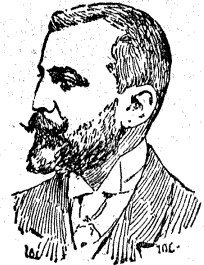
El ministro de Instrucción Pública y Bellas Artes Sr. Jimeno.