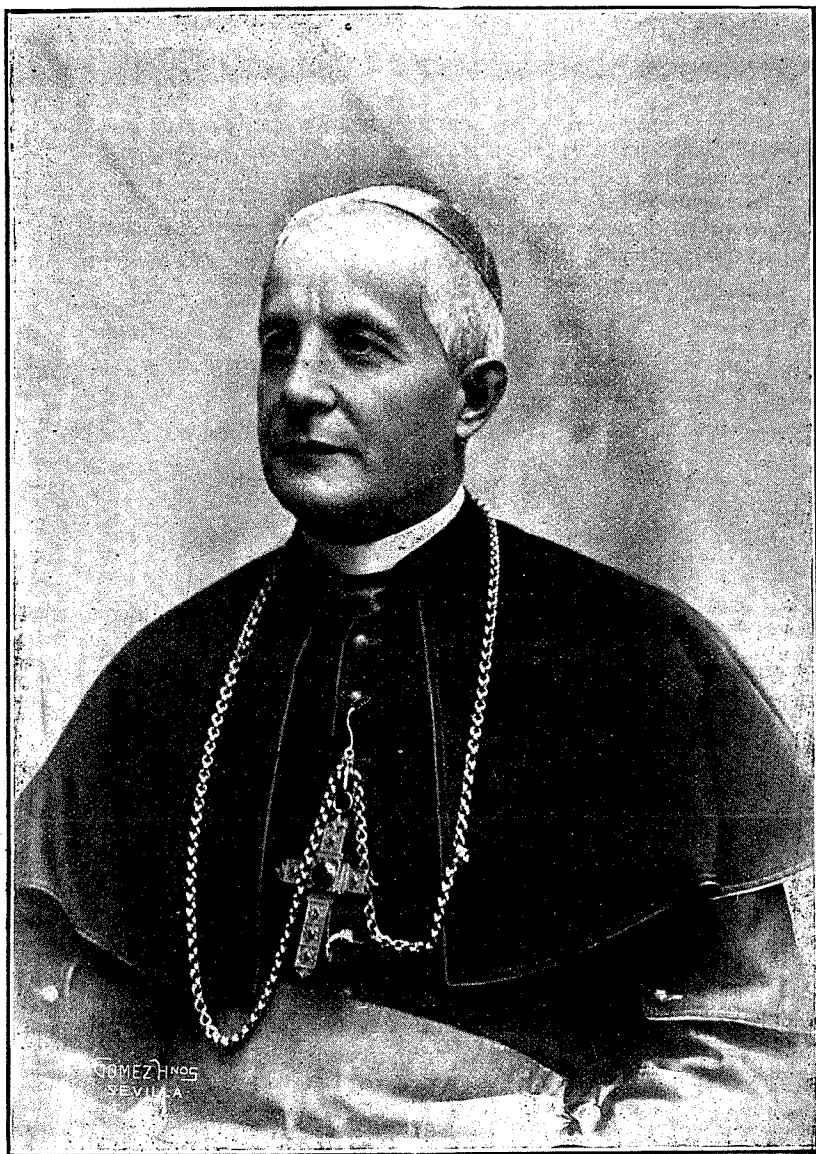
Monseñor Francisco Ragonessi Nuncio de S. S. en España

Se admiten suscripciones á "Ora et Labora" y "La Pa- lestra" juntamente, por el precio de una peseta la tem- porada.—Anuncios. Precio por inserción: Una plana, 100 pesetas; media 50; un cuarto, 25; un octavo 13; medio oc- tavo, 7.