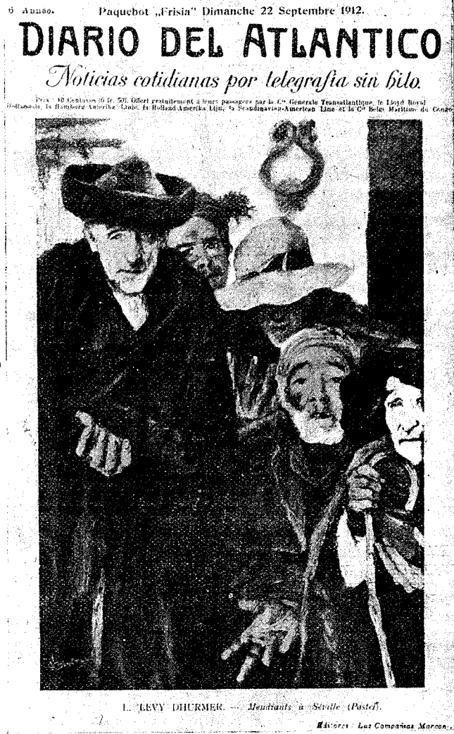
Portada exterior del Diario del Atlántico publicado el 22 de Septiembre de 1912 a bordo del Paquebot «Frisia» de la Compañía Lloyd Royal Hollandais y que hace el servicio Holanda-España-Brasil-Argentina.

(Véase el artículo El Diario del Atlántico ).