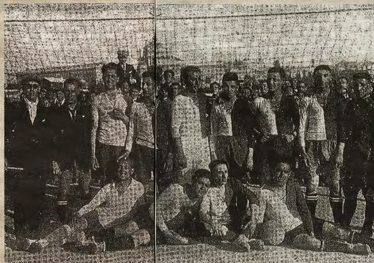
Equipo del Toledo FC en una competición organizada por el diario El Castellano en la primavera de 1924