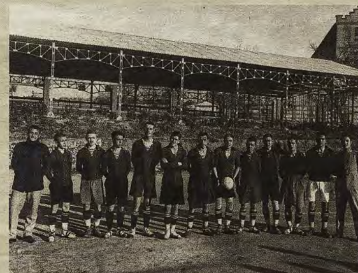
Equipo de fútbol de la Academia delante del primitivo gimnasio cubierto cerca del antiguo cuartel de San Lázaro.