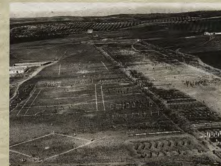
Campos deportivos de la Escuela Central de Gimnasia, creada en 1919, en una vista anterior a 1936