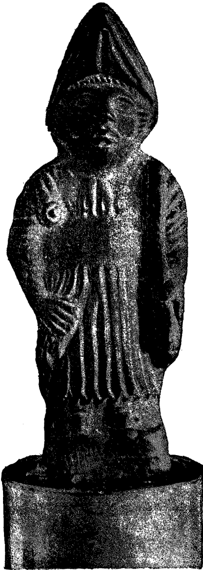
Figura de barro cocido

Conste, pues: 1.º, que entre los datos que puede recoger sobre la demolición del resto del palacio, no hay ninguno referente al dictamen contrario de la Comisión, á quien aplaudo en este asunto; 2.º, que sigo lamentando el silencio, casi el secreto, en que ésta guarda sus trabajos; y 3.º, que repito lo que muchos me