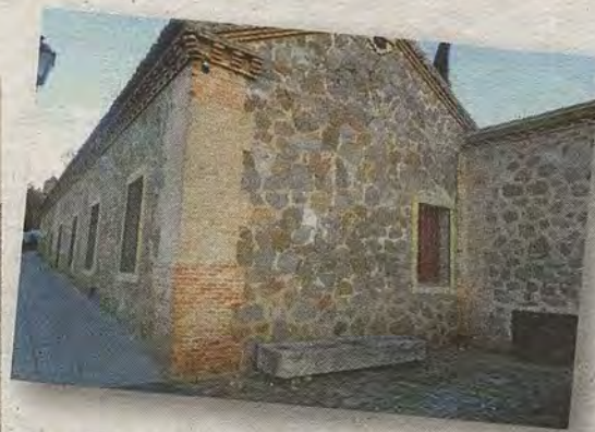
Pilar caído junto al antiguo matadero