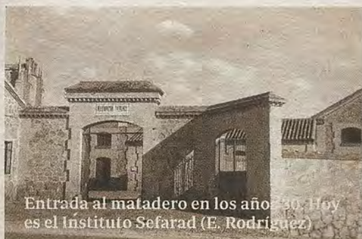
Entrada al matadero en los años 30. Hoy es el Instituto Sefarad (E. Rodríguez)

Un pilar que pervive frente a la entrada del antiguo Matadero. Paisaje del Tajo tras el poste de piedra