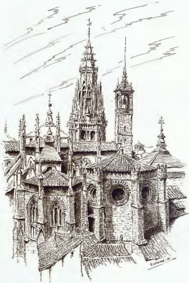
Torre del Reloj de la Catedral en 1887