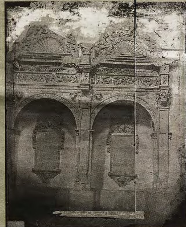
Capilla de San Pedro Mártir. Sepulcros de los condes de Melito, hacia 1880.

dos, estarían lejos de tener suficientes «garantías museológicas».