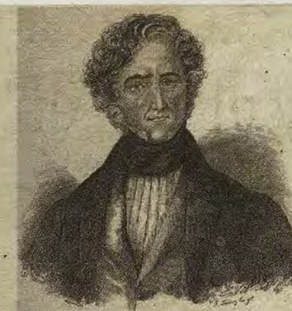
El ministro de Hacienda Álvarez Mendizábal (1790-1853) en un grabado de José Gomez.