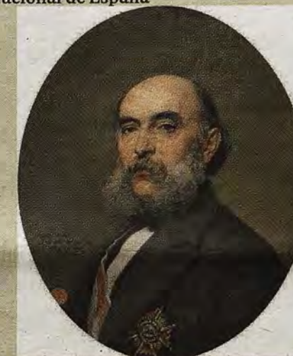
José Amador de los Ríos, retratado por Federico de Madrazo en 1876. Real Academia de Bellas Artes de San Fernando