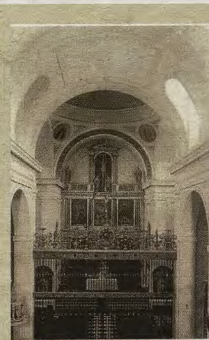
Interior de la capilla en una fotografía de Rodríguez. Archivo Histórico Provincial

ABC DOMINGO, 4 DE FEBRERO DE 2018 abc.es/espana/castilla-la-mancha/toledo