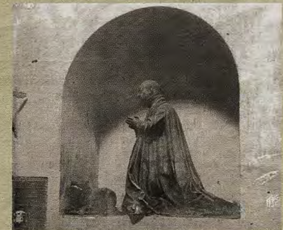
Estatua orante de Pedro Soto Cameno en San Pedro Mártir hacia 1880.