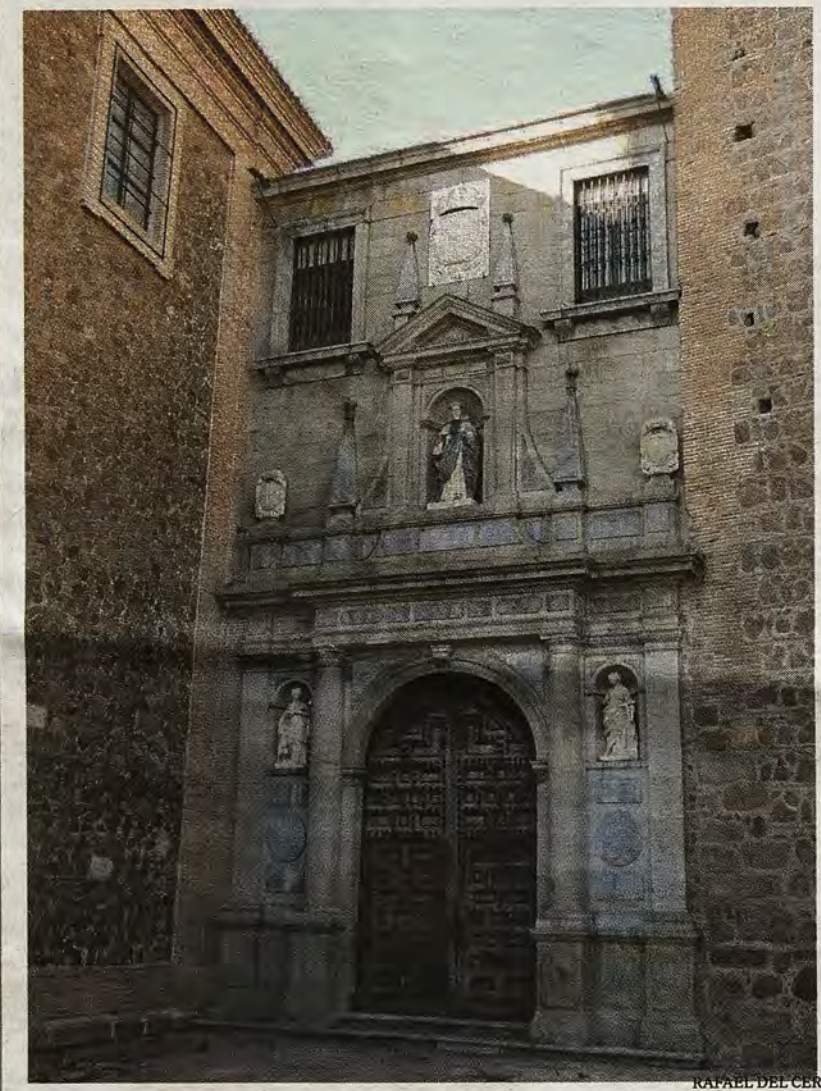
Capilla de San Pedro Mártir, primera sede del Museo Provincial en 1844

Uno de los grandes conventos toledanos es el de San Pedro Mártir, casa que fue de la Orden de Predicadores creada por el burgalés Domingo de Guzmán en el siglo XIII. Los primeros frailes dominicos llegaron a Toledo en 1230, en el reinado de Fernando III, instalándose fuera de las murallas, en la Huerta del Granadal, cercana a la Puerta Nueva, en un cenobio que dedicaron a San Pablo. En 1407 se trasladaron al interior de la ciudad, junto a la iglesia de San Román, a unas casas de la poderosa noble Guiomar de Meneses († 1454). Al cabo de un siglo, el cenobio -ahora dedicado a San Pedro Mártir-, era ya una rica comunidad extendida por fincas vecinas, llegando a crear, en épocas posteriores, dos cobertizos sobre una calle para alcanzar otras manzanas. La casa dominica sería pues una macla de edificaciones con varios patios, una torre mudéjar, el espléndido Claustro Real -trazado por Alonso Covarrubias en 1541- la gran capilla, en la que trabajaron Nicolás Vergara el Mozo y Juan Bautista Monegro, más otras estancias habilitadas en el siglo XVIII. En este lugar se dieron cita señalados hechos en la historia local como fueron las Cortes de 1480, la primera imprenta de la ciudad (1483), el Tribunal de la Inquisición (1485), un Estudio General de Artes, Teología y Derecho Canónico (1583) y la estancia de la Universidad entre 1789 y 1799.