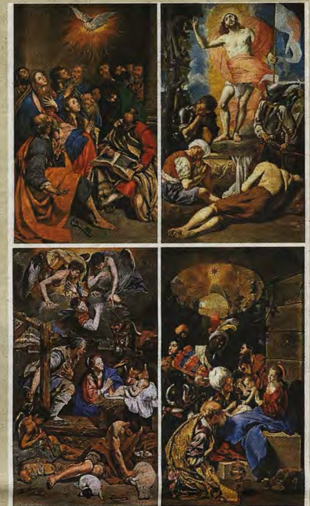
Las Cuatro Pascuas. Obras de Juan Bautista Maino, en 1612, para el retablo mayor de San Pedro Mártir. Museo del Prado

En 1846, con dos años de vida, el Museo Provincial dejaría la sede dominica ante la llegada a Toledo del Colegio General Militar que se asentaría en tres edificios de la Beneficencia Provincial: la Casa de la Caridad y los hospitales de Santiago y de Santa Cruz. Esta decisión del Ramo de Guerra empujó a