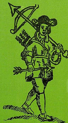
Ilustración popular de libros infantiles que circularon hacia mitad del S. XIX.

Soy rústico montañés ; mas quien de mi se burlare tal cual soy será al revés.