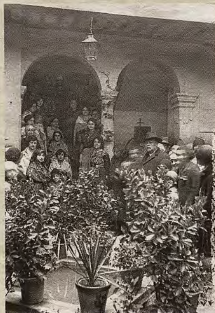
Asistentes en la jornada inaugural de la Casa del Maestro el 25 de marzo de 1928.

ría o del pintor francés Jean Marzelle, además de las temporadas vividas por muchos artistas de origen europeo, americano o asiático que dejaron en las paredes un recuerdo gráfico, que aún pervive, en forma de óleos, dibujos, acuarelas o grabados. También residieron docentes, funcionarios y técnicos de las administraciones públicas, algunas de estas personas, como Mercedes Mendoza