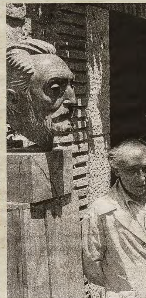
El escultor Victorio Macho (1887-1966) uno de los alojados en la Casa del Maestro en los años cincuenta.