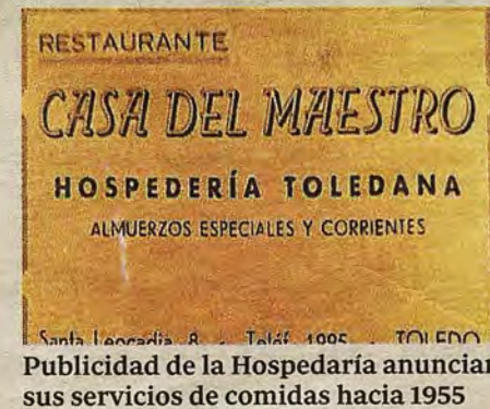
Publicidad de la Hospedería anunciando sus servicios de comidas hacia 1955