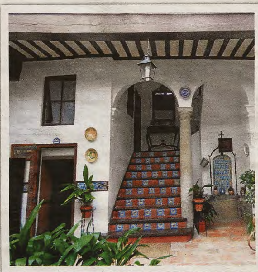
Lateral del patio que acoge la escalera y el aljibe.

Pronto comenzaría la actividad de la institución. En abril allí almorzaban excursionistas de la Asamblea Pedagógica Nacional celebrada en Madrid. En mayo conferenciaron sobre temas de arte Vegue y Goldoni, Gallego Burín y Torres Balbás. En 1929 y 1930, los inspectores Lillo y Asensi, en colaboración con la Escuela Central de Educación Física, organizaron cur-