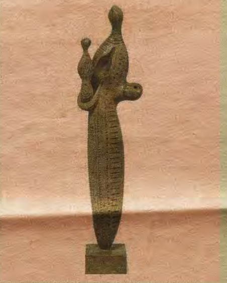
Maternidad. Escultura de Alberto Sánchez