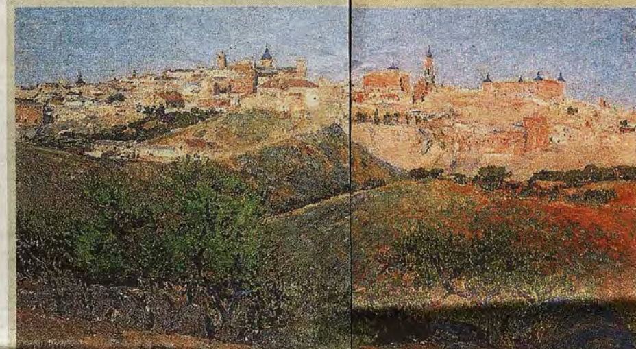
Panorámica de Toledo desde los Cigarrales por Aureliano de Beruete