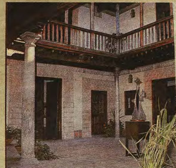
Patio del Museo de Arte Contemporáneo en 1978. Revista Cuaderno de Cultura