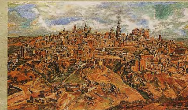
Benjamín Palencia. Toledo (1943)