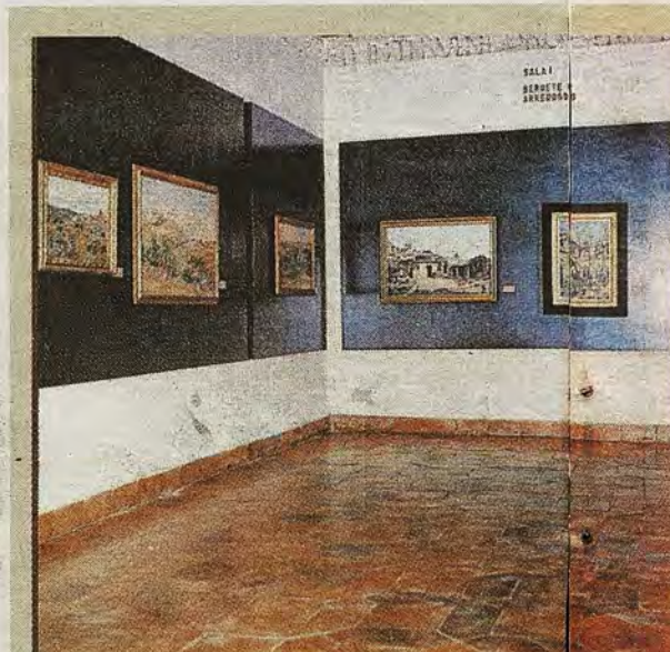
Sala con obras de Arredondo y Beruete. Revista Cuaderno de Cultura , 1978

DOMINGO, 1 DE OCTUBRE DE 2017 ABC abc.es/espana/castilla-la-mancha/toledo