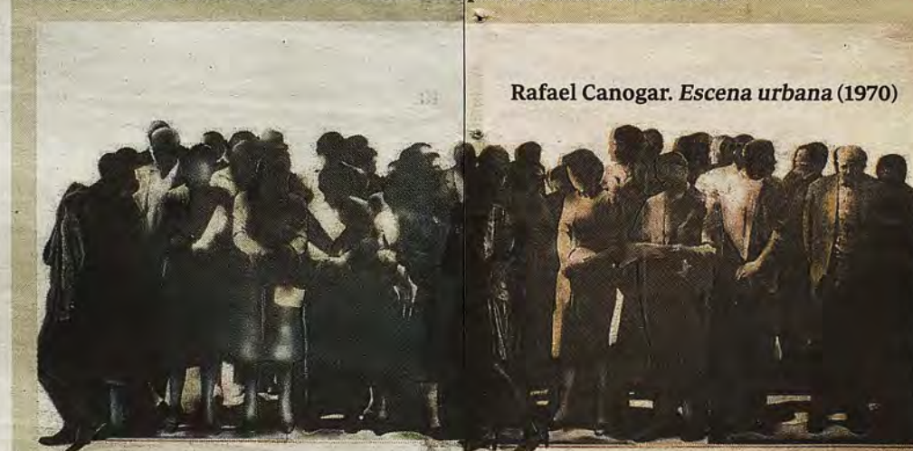
Rafael Canogar. Escena urbana (1970)

guardista. El mensaje oficial acentuaba mucho la rehabilitación de la Casa de las Cadenas como un digno contenedor de arte moderno... pero siempre tamizado. Sobre esta base se reunieron más de medio centenar de autores que Florencio de Santa-Ana desgrana en el Catálogo del museo de 1975. En la selección se dio relevancia a la huella de artistas toledanos y a la imagen de la propia ciudad, como era Alberto Sánchez (1895-1962) -con más de una veintena de esculturas, dibujos y bocetos