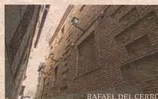
Detalle de la fachada conservada en el callejón del Lucio

Fachada posterior en la plaza de Horno de los Bizcochos.