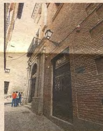
Puerta de acceso al antiguo escenario de la sala