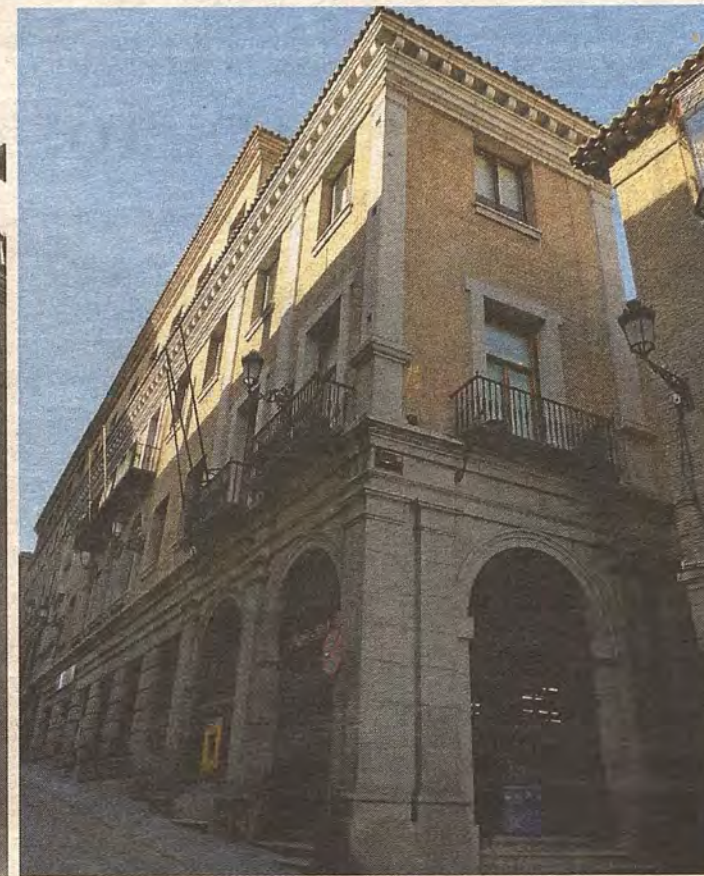
El Teatro-Cine Alcázar en los años sesenta y en 2015.