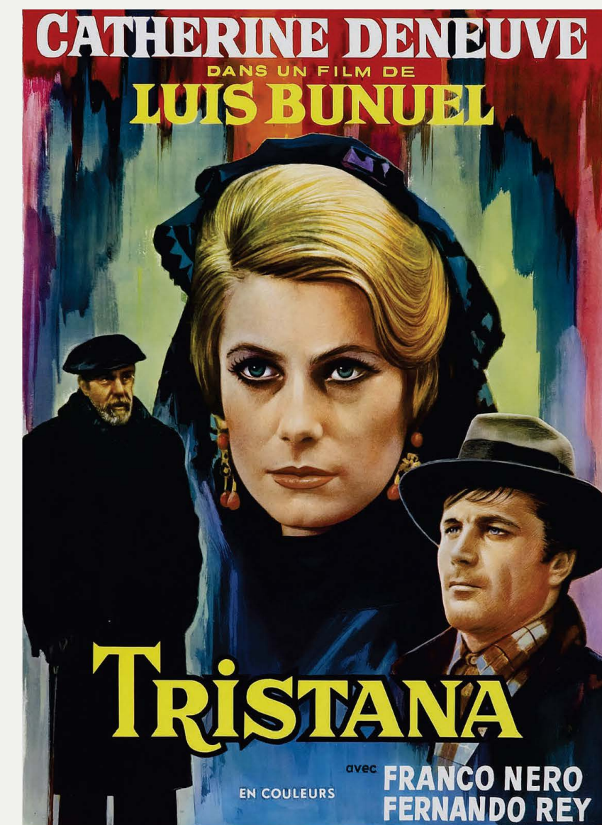
Cartel de la película Tristana (1970)