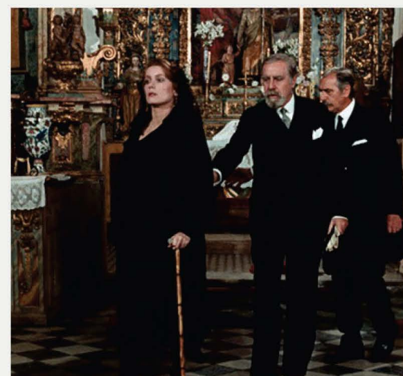
Fotograma de la boda entre Don Lope y Tristana en la iglesia de San Justo