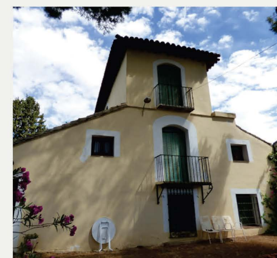
Fachada del Cigarral Loreto con el balcón central al que se asoma la tullida Tristana ante el joven Saturno