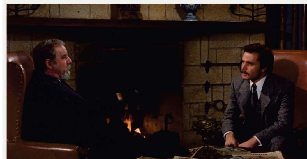
Fernando Rey y Franco Nero en la escena rodada en el vestíbulo del Hotel del Lino. Fotograma de Tristana