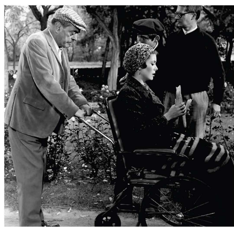
Luis Buñuel y Catherine Deneuve preparando la secuencia que discurre en el paseo del Tránsito

En sus etapas mexicana y francesa, Buñuel ya había incluido una fugaz imagen toledana en Viridiana (1961) y Belle de jour (1967), sin lograr, desde 1963, el permiso de la administración franquista para dirigir en la ciudad la historia de Tristana . A punto de llevarla a Coímbra, las trabas decayeron en 1969 tras una mediación ante el ministro de Información y Turismo, Manuel Fraga, que le anticipó la ausencia de inconvenientes desde los servicios de «apreciación y censura» para autorizar el rodaje. El 7 de octubre, la Comisión Permanente del ayuntamiento toledano aprobaba fijar un canon de 60.000 pesetas a Época Films -una de las tres productoras de Tristana - por el «rodaje de película». Esa Comisión en una sesión anterior (30 de septiembre) había exigido otros trámites a Coral Films, interesada en realizar