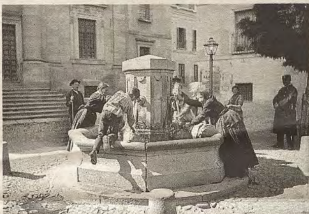
Cogiendo agua bajo la atención de un guardia en una fotografía de Casiano Alguacil (Archivo Municipal de Toledo)