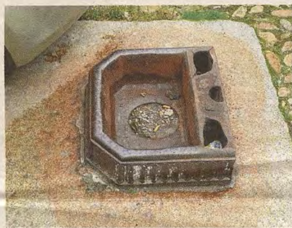
Restos de una fuente metálica en el Corredorillo de San Bartolomé