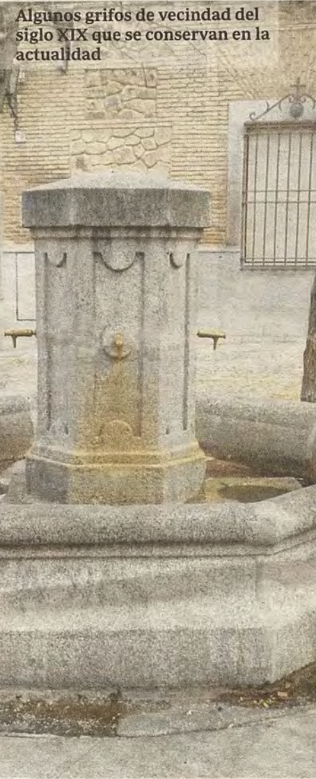
Algunos grifos de vecindad del siglo XIX que se conservan en la actualidad