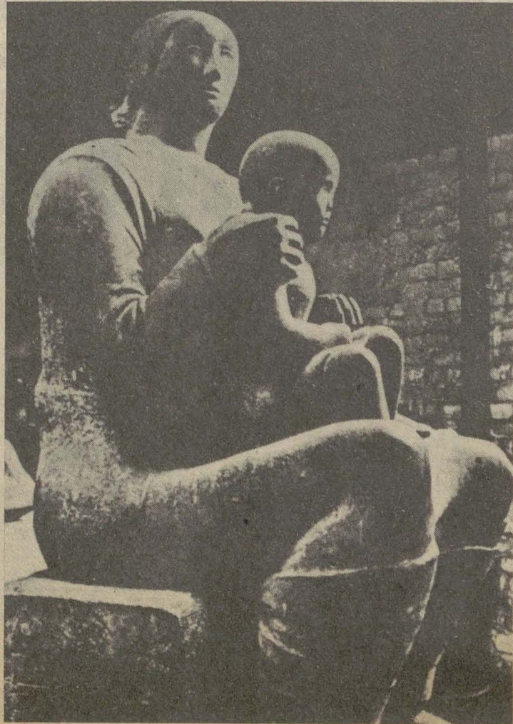
Henry Moore: "Virgen con el Niño".

"Florecitas que he encontrado en los jardines y los bosques, me habéis ofrecido observaciones como vosotras las habéis suministrado, en las bellas épocas de ornamentos, a los escultores y a los vidrieros": estas palabras fueron escritas por Auguste Rodin en "Les Cathedrales de France", obra publicada en 1914, poco tiempo antes que Laon, Reims, Soissons, presentaron un luminoso cuadro bajo el devastador fuego de la artillería. Los movimientos de revalorización del estilo gótico, nacidos al amparo de una romántica vuelta a los modelos medievales, cuaja-