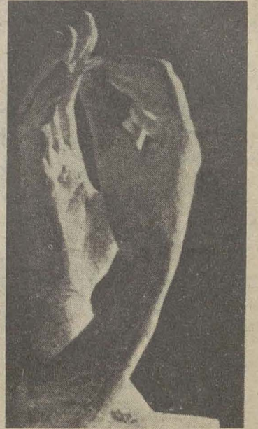
Auguste Rodin: "La Catedral".

Rodin trabaja el barro girando en torno al material: así van surgiendo sus figuras; individualiza ciertos detalles y los ensaya una y cien veces, martiriza a los modelos del taller repitiendo un