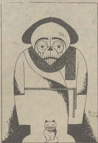
Pío Baroja, por Vázquez de Sola.

Nadie, quizá, con más poder de captación que él, vasco, vecino a los navarros, añorante de aguas marinas, viajero y peregrino a la Cuenca que poblaron antaño vascos y navarros de cuando su conquista. En