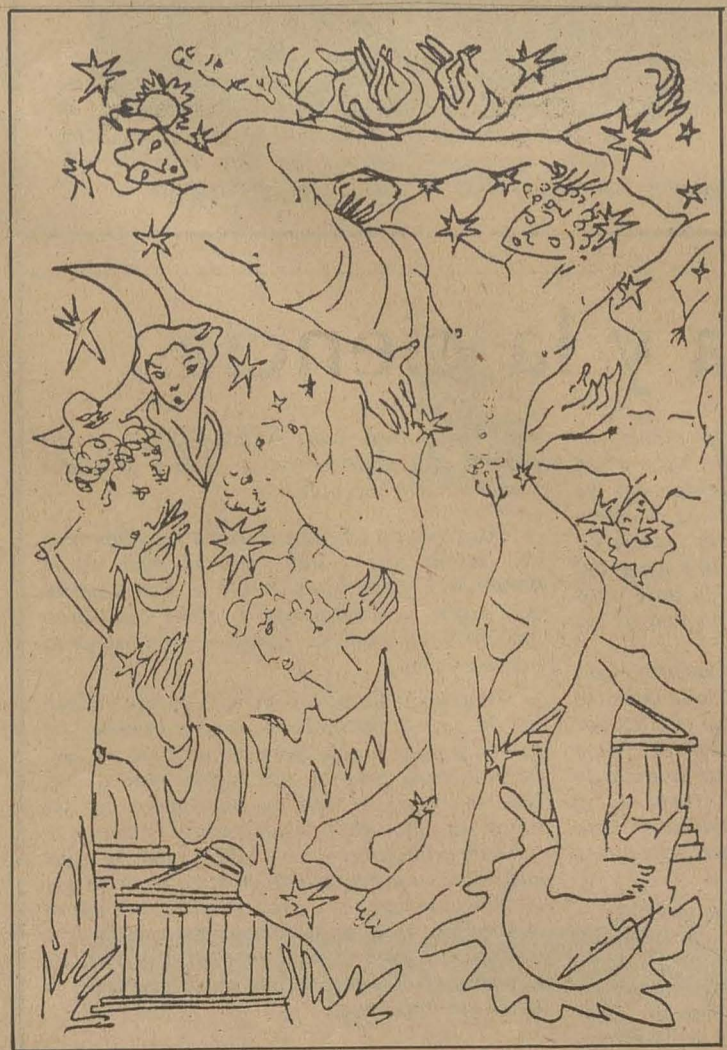
Dibujo de Carlos de la Rica

I Tomó de los nobles lujos y alabanzas Sus ávidos oídos la voz del Africano Consideró hermoso cenar con Lelio Por su encanto frecuentó la Villa Albana Al fin Terencio en la miseria máxima Huyó la mirada de los hombres En una aldea de la Arcadia Magna Nada valió Escipión o Lelio Nadie pagó choza o torpe esclavo Que nos anunciara su muerte.