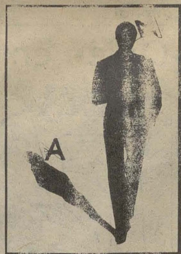
Poema de Xavier Canals