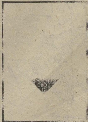
Poema de J.M. Calleja