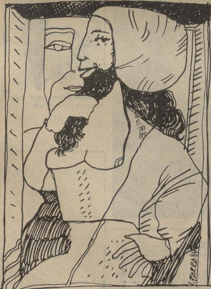
Dibujo de Isidro Parra