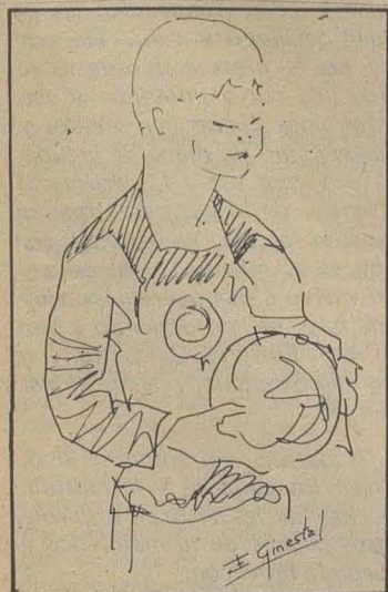
Ilusión, por Enrique Ginestal