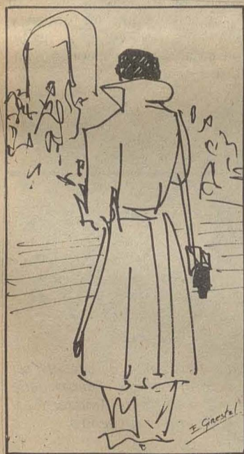
¡Pieza! por Enrique Ginestal

Un párrafo de Lennon (pág. I) Tal como éramos, por Isidro Sánchez (pág. II) Cartas de un bravucón (pág. II) Alfredo Alcain, por Luis Gordillo, y viceversa (pág. III) Un dossier de poesía (pág. IV) Lina López, novel poetisa (pág. IV)