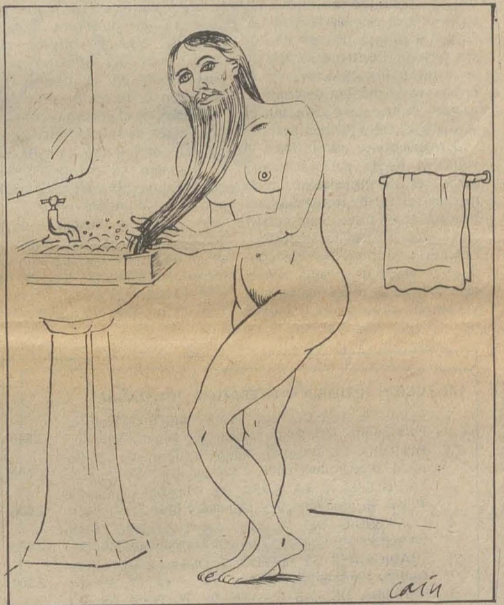
Dibujo de Caín