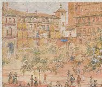
Aspecto de Zocodover hacia 1830