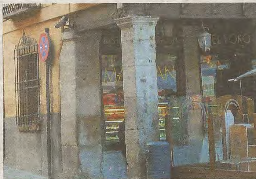
Esquina con el pilar que contiene la inscripción

En 1641, de nuevo, Zocodover sufrió otro incendio que afectó esta vez a la Real Aduana, situada en el extremo derecho de los soportales del Arco de la Sangre, en el inicio de la subida al Alcázar. En 1656 el Ayuntamiento aprobada la rehabilitación de los edificios calcinados así como levantar, en el comienzo de la cuesta, una casa de dos plantas apoyada en dos parejas de ar-