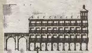
Alzado de los arcos y portales del Peso Real (s. XVIII)