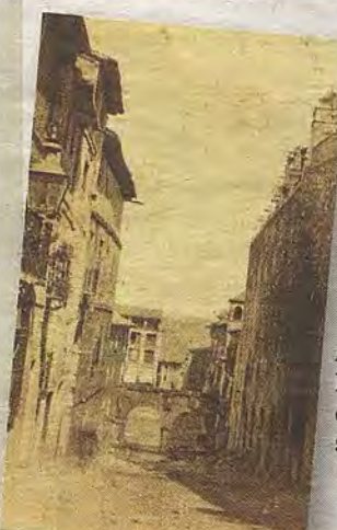
Los arcos antes de 1865 desde la cuesta del Alcázar