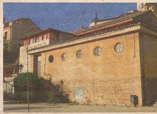
Casas de baños en 2014