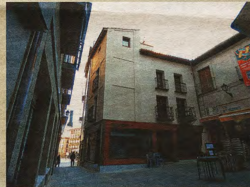
Plazoleta de Barrio Rey en 2018. En el centro, el inmueble que debía ser derribado para abrir la Gran Vía hacia Zocodover.

la calle del Comercio, frente a citada la plaza de Solarejo, algo que ya motivó algunas suspicacias en la opinión pública de la época.