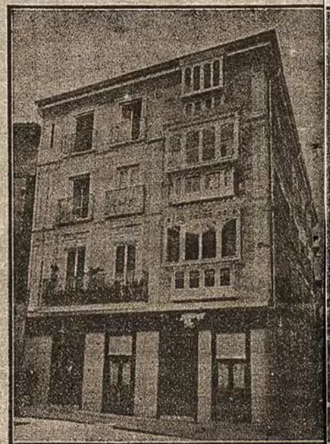
Barrio Rey, 2, 4 y 6, Teléfono 14, TOLEDO