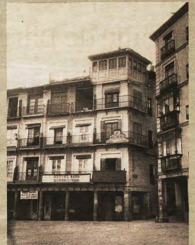
Esquina del Peso Real en la entrada de Barrio Rey con el «torreón» que debía ser derribado en 1922.