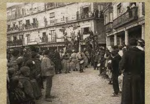
Procesión en la mañana de Jueves Santo saliendo desde Barrio Rey a Zocodover.