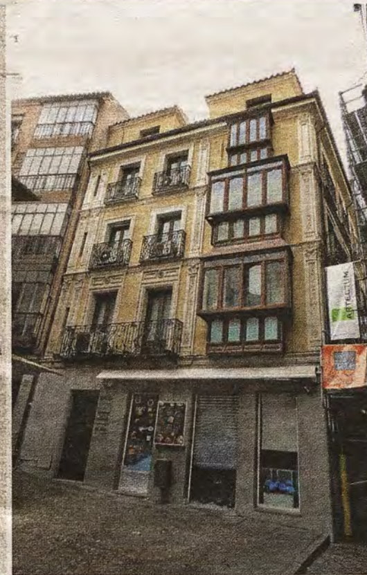
RAFAEL DEL CERRO