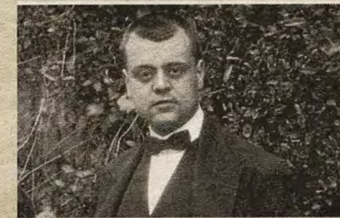
OTRO ÉXITO NUESTRO SE DETIENE UN NUEVO ATENTADO A LA PLAZA DE ZOCODOVER

o de Zocodover, para coger sus coches. En 1961, al efectuarse otra reforma en esta última plaza, Barrio Rey (ahora con un escalón en su acceso por Zocodover) seguía siendo una vía peatonal con concurridos bares, casas de comidas y un hotel (el Maravillas ) que, a pesar de los temores, recibía a los protagonistas del mundo taurino cuyos hais aparcaban en la Magdalena. Al final, el espíritu de Barrio Rey continuó fiel a su propia historia, borrándose el sueño de algunos ciudadanos para crear un inapelable signo de modernidad: la Gran Vía de Toledo